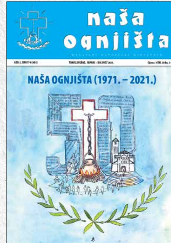
Naša ognjišta, aktualni broj, srpanj – kolovoz 2021.