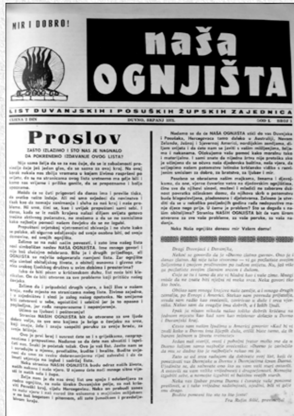
Naša ognjišta, prvi broj, srpanj 1971.

Poznato je da je komunizam u Bosni i Hercegovini bio najrigidniji u čitavoj Jugoslaviji, pa je time pojavljivanje jednoga katoličkog lista upravo