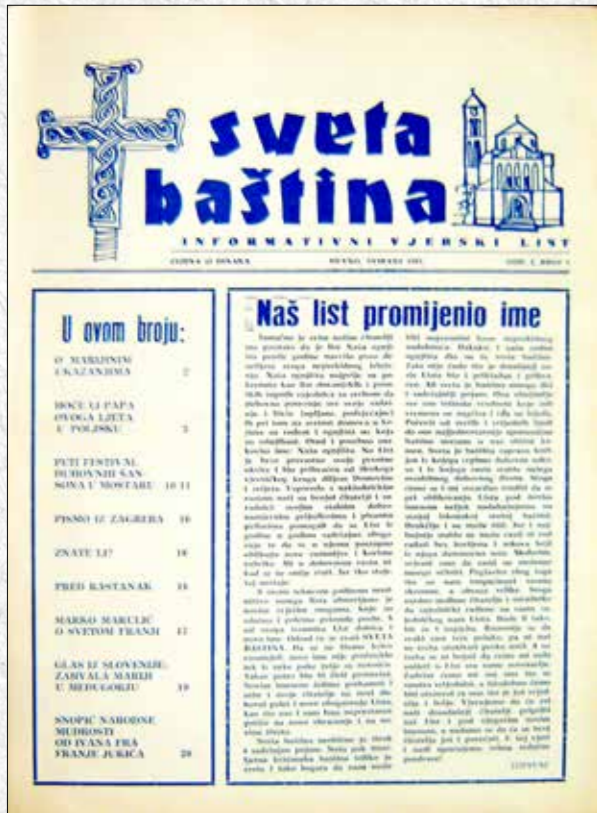
Sveta baština - prvi broj, svibanj 1982.

u toj republici bio još veće čudo. Kako je dakle moguće da su komunističke vlasti uopće dopustile pojavu katoličkog lista? Više je razloga za takvu „popustljivost“, a u prvome redu valja navesti pokušaj uspostave kakvih-takvih odnosa između komunističke Jugoslavije i Vatikana, što je konačno rezultiralo uspostavom punih diplomatskih odnosa, prekinutih u potpunosti 1952. godine: u lipnju 1966. potpisan je Protokol , a puni diplomatski odnosi uspostavljeni su posjetom predsjednika SFRJ Josipa Broza Tita papi Pavlu VI. u ožujku 1971., pa su i komunističke vlasti postale barem malo tolerantnije, želeći pokazati ljepše lice pred svijetom. Valja se prisjetiti i da je upravo u to vrijeme dašak slobode nagovijestilo i Hrvatsko proljeće, to jest pokret hrvatskih komunista, a pogotovo intelektualaca i studenata, za više slobode i ravnopravnosti hrvatskoga naroda u SFRJ; taj je pokret brutalno skršen na sjednici Centralnog komiteta Saveza komunista Jugoslavije u Karadorđu 29. studenog 1971. K tome, i Crkva se pomalo oporavljala od strašnih udara koje je dobila u vrijeme Drugoga svjetskog rata, a možda još više porača, pa se nekako moglo razmišljati i o svojevrsnim pozitivnim pomacima u pastoralu vjernika, između ostalog i pokretanjem kojega katoličkog lista.