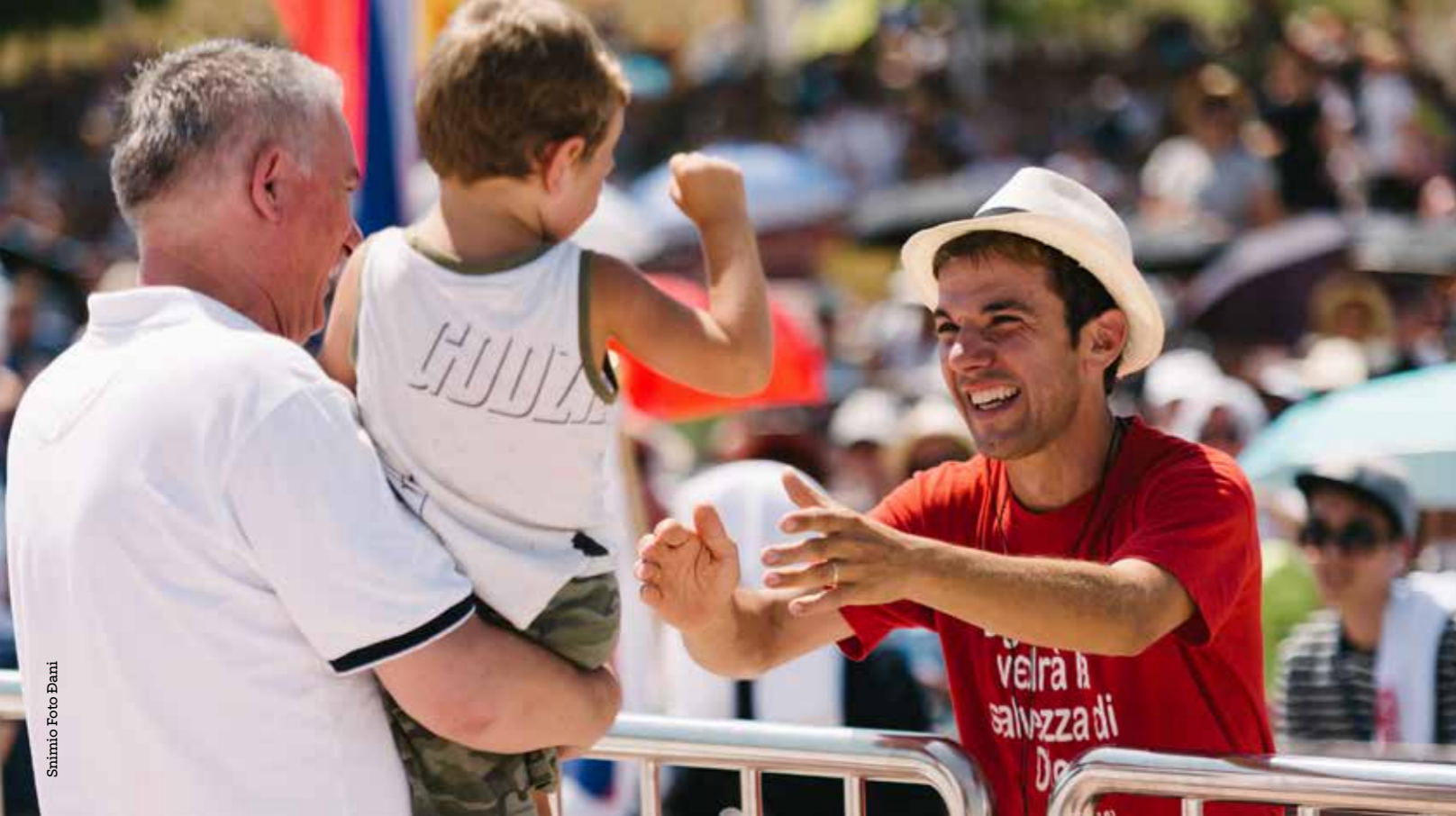
Salmio Foto Diani