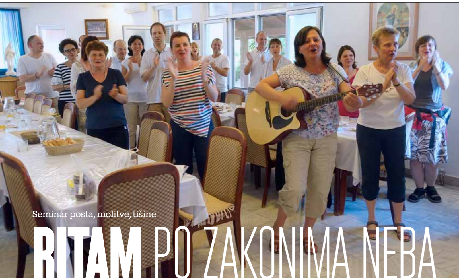
Seminar posta, molitve, tišine