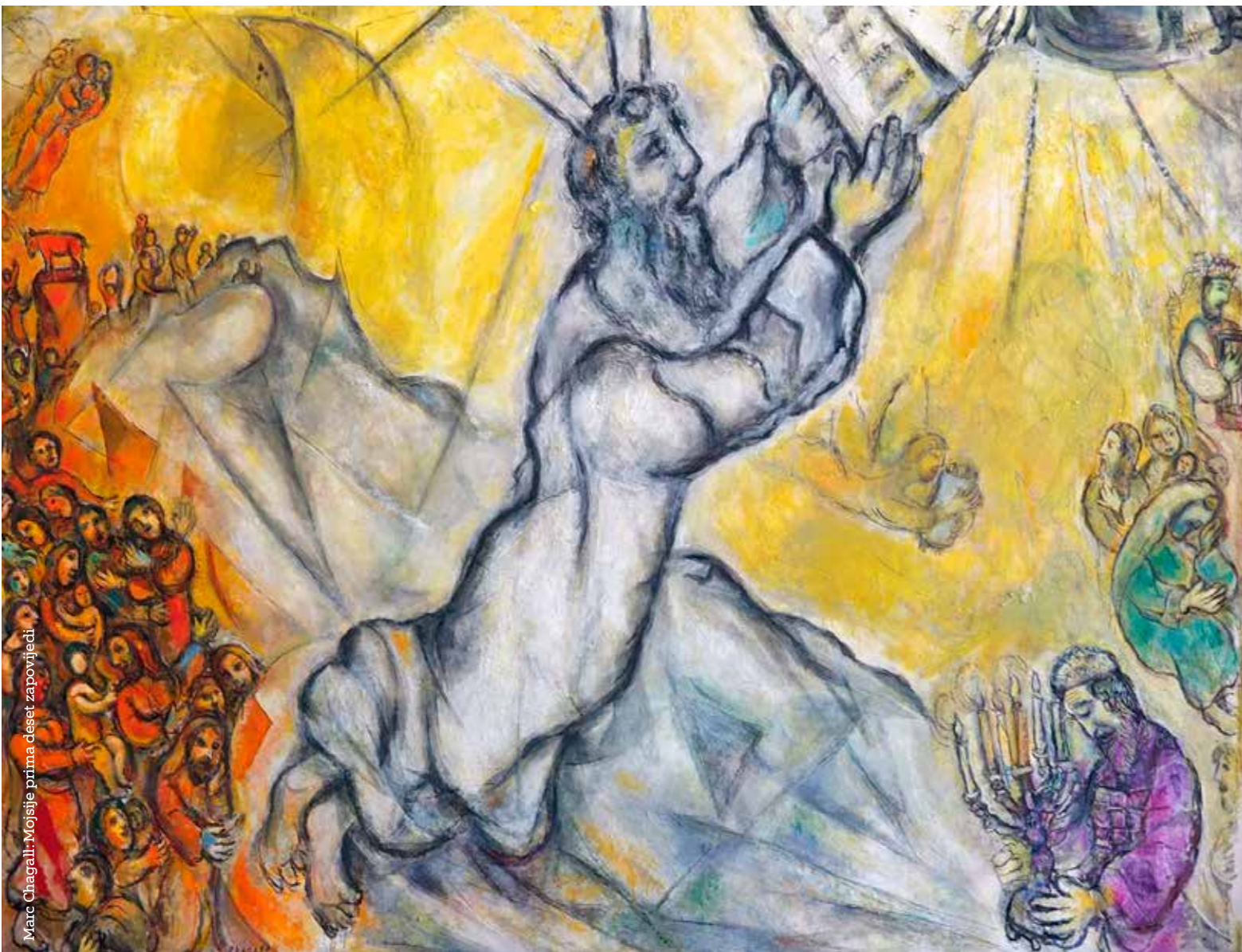
Marc Chagall: Mojsije prima deset zapovijedi