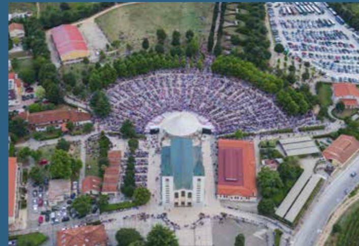
Fotografija na naslovnici: Foto Đani