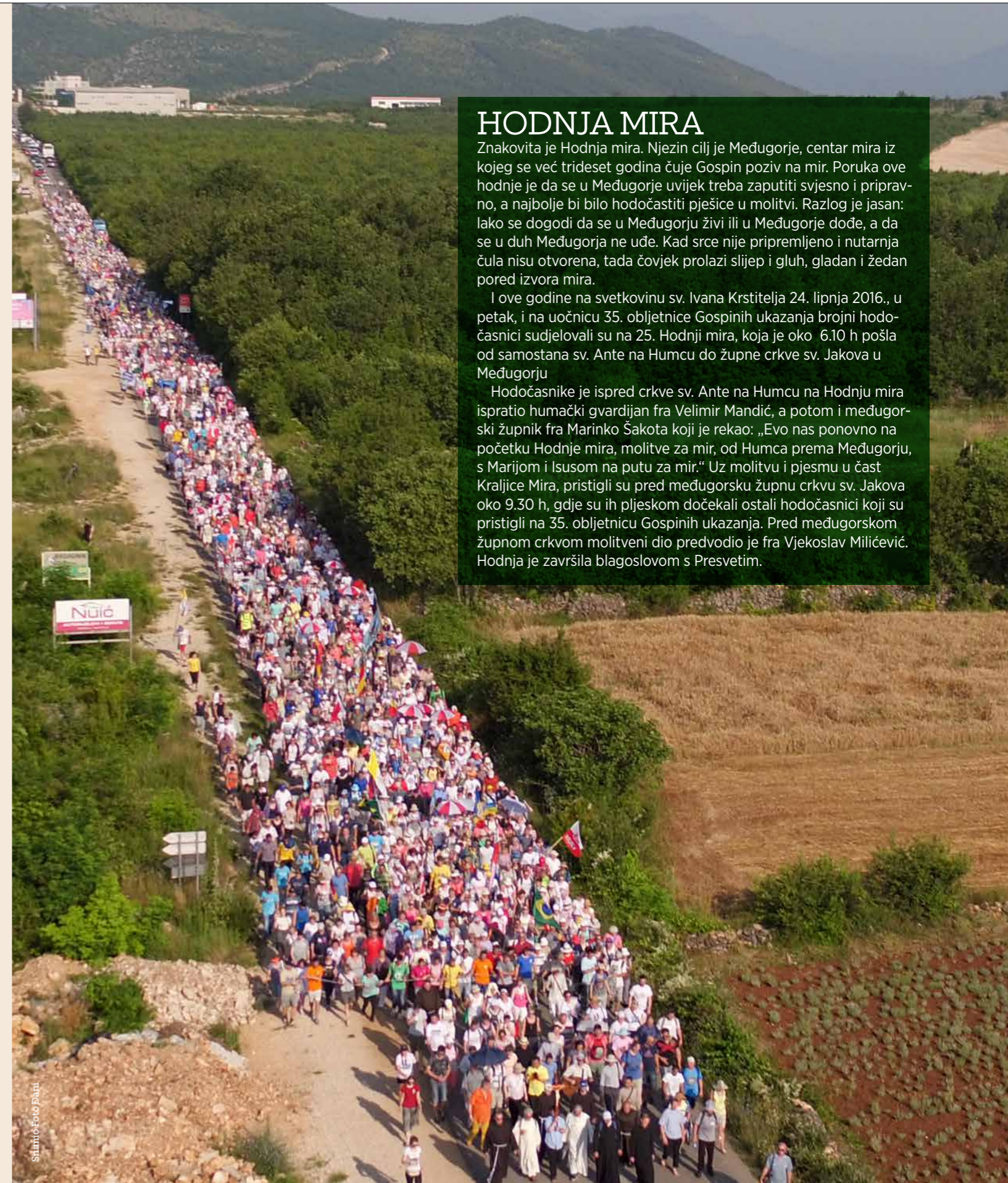
Stimio Foto Danu