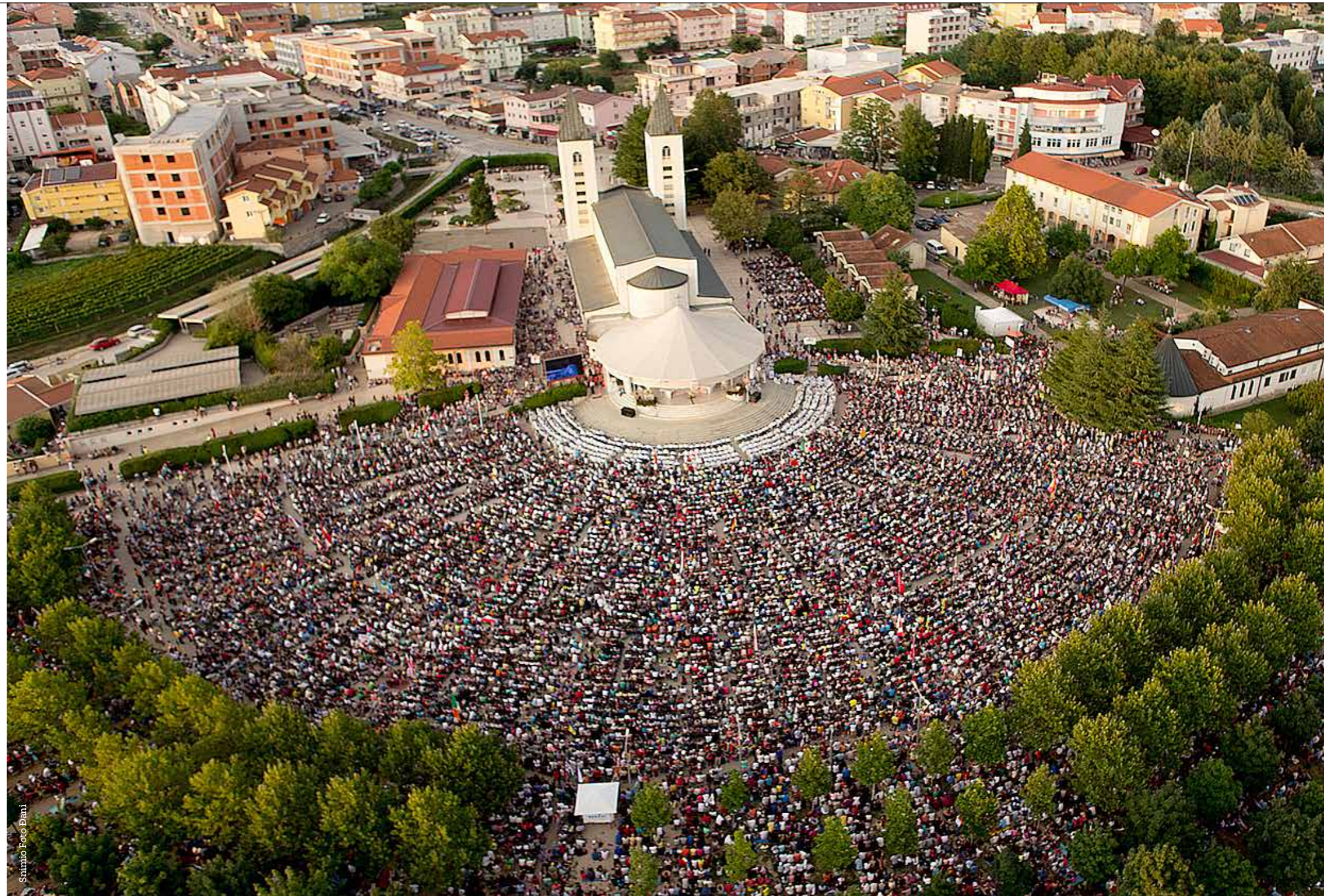
Saintho Foto Danni

Ono što mi je posebno privuklo pažnju bila je filozofska podloga samog festivala. Cijelo ovo događanje naime ima i svoju 'duhovnu dimenziju'. U korijenu ovog događanja je tzv. PLUR (Peace Love Unity Respect) filozofija, koja je u osnovi vrlo slična hipijevskom pokretu 60-ih godina