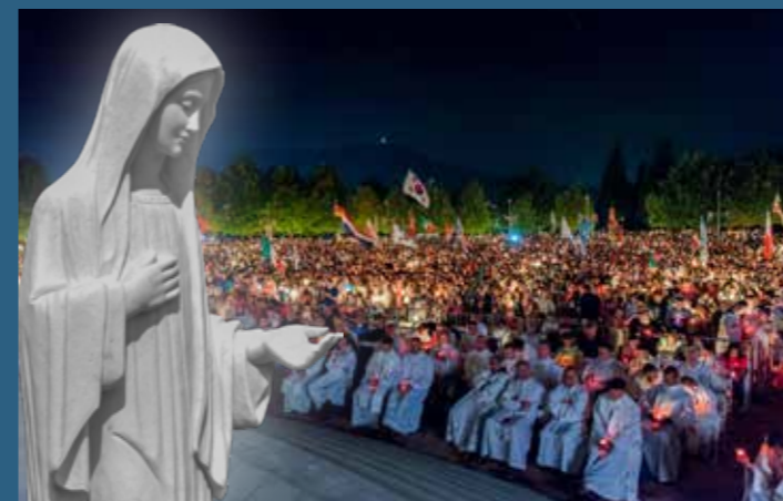
Fotografija na naslovnici