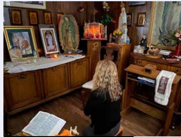
Kapela u Međugorskom informativnom centru