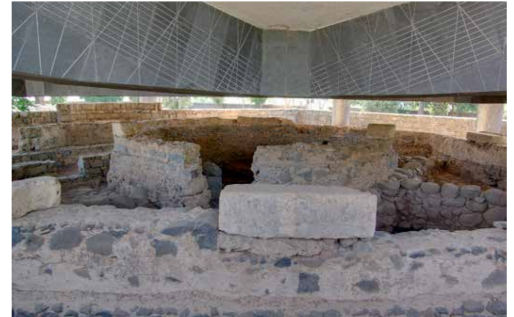
Ostatci kuće sv. Petra

spretno dolazimo u posjed mjesta između 1890.-'94. g. U početku su nađeni ostatci sinagoge iz 5. st. ispod koje se, po svojoj prilici, nalaze ostatci one iz Isusova vremena, što je vidljivo i po samom kamenu. Stara sinagoga je rađena crnim, bazaltnim kamenom te je razlika lako uočljiva. U početku prošloga stoljeća nađeni su i ostatci nečega što je nama kršćanima od neprocjenjive vrijednosti. A to nešto je ni manje ni više nego Petrova kuća, tj. Isusova kuća!