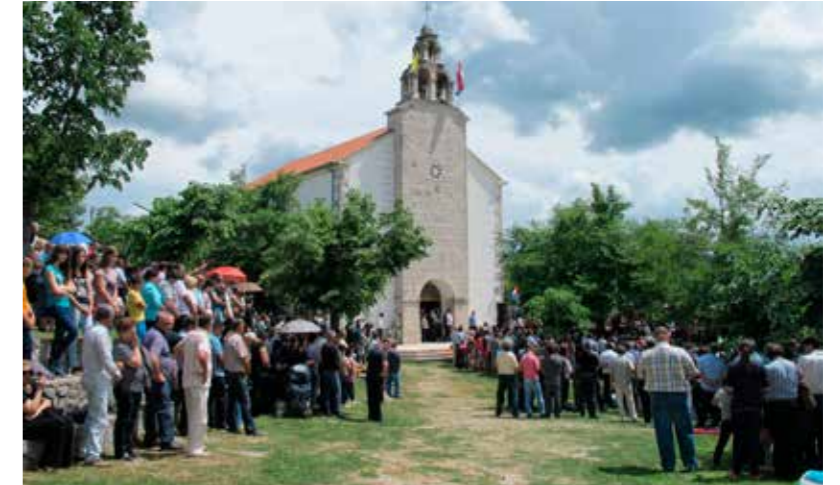
Župna crkva Bezgrješnoga začeca BDM

SVETIŠTE KRALJICE MIRA JEDNO JE OD MJESTA U HERCEGOVINI NA KOJEMU SE, UZ ISPUNJENE UVJETE KOJE CRKVA TRAŽI, MOŽE DOBITI POTPUNI OPROST KROZ CIJELU GODINU MILOSRĐA.