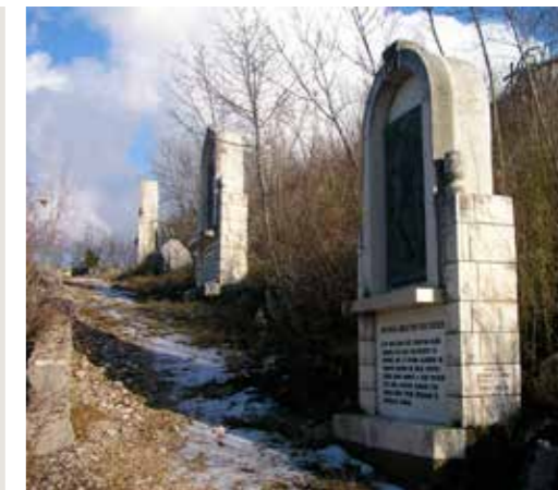
Križni put u podnožju Gradine

Majko Crkve, primi našu posvetu, čuj našu molitvu, jačaj našu odluku! Vodi nas Srcu Spasitelja našega Isusa Krista da s njim i po njemu na svršetku našeg zemaljskog putovanja uđemo u puninu radosti Presvetoga Trojstva: Oca i Sina i Duha Svetoga! Tako neka bude! Amen!