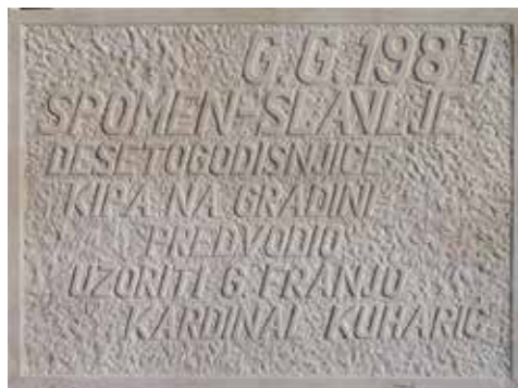
Ploča podno kipa prigodom posjete kardinala Kuharića

Kontakt: Župa Bezgrješnog začeca Blažene Djevice Marije, Svetište Kraljice Mira Hrasno - Neum, 88394 Hutovo Tel./fax.: ++387 36 883-004 Web: www.hrasno.info E-mail: zupa.hrasno@gmail.com