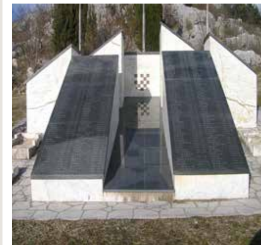
Spomenika žrtvama Drugoga svjetskoga rata župe Hrasno

Hrasno se nalazi u krševitom neumskom zaleđu u Trebinjsko-mrkanskoj biskupiji na središtu zračne linije Mostar-Dubrovnik. Smješteno je na nadmorskoj visini od oko 250 metara i okruženo je brdima među kojima su najpoznatija: Žaba na jugozapadu i Budisavina na sjeveru. Ima malo obradive zemlje i uglavnom je pokriveno niskom šumom graba, jasena, kljena i hrasta, a s obzirom na klimatske uvjete, predstavlja idealno područje za uzgoj duhana. Već stoljećima se nalaze na granici između svjetova, država te različitih kultura. Nažalost, ljudi iz tog kraja, što zbog ratova i politike te potrage za boljim životom, raseljeni su po cijelome svijetu... Iako se u župu Bezgrješnog začeca Blažene Djevice Marije i svetišće Kraljice Mira može doći iz čak pet pravaca, nijedan put nije lagan niti ugodan. Ceste su uglavnom loše, oštećene i vijugave, a na većini dionica se jedva mimoidu dva automobila. Put krivuda, penje se i spušta na manje ili veće prijevoje, polja, dolinice, a poslovično se lako izgubiti ili pogrešno skrenuti.