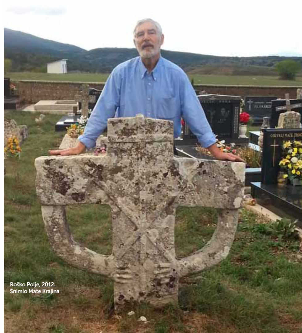
Roško Polje, 2012.

riti sva zaključana vrata i pokazati nam putove kroz tamu vremena u kojemu živimo. Stvarnost je sljedeća: Isus je gospodar nemogućega. On može donijeti neku vrstu katoličke renesanse kulture u novoj evangelizaciji. Naš je zadatak odgovoriti na tu milost. Moje su knjige postale uspješnicama na mnogim jezicima i to je znak da Bog može učiniti nemoguće. Ali mi moramo moliti da se to dogodi mnogim kreativnim ljudima koji će imati hrabrosti iskoračiti u vjeri, koji su spremni žrtvovati se i rasti u povjerenju. Krist će donijeti dobre plodove ako napravimo svoj dio.