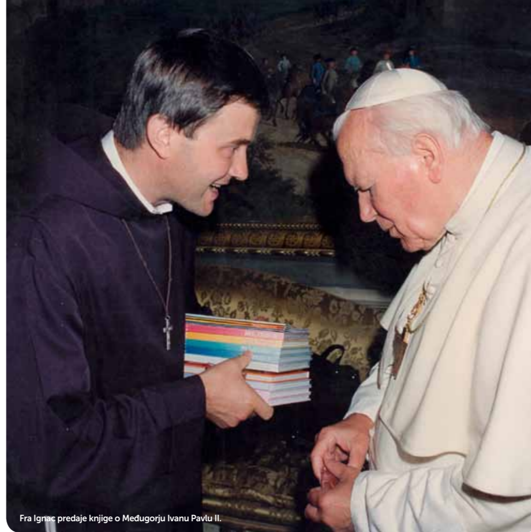
Fra Ignac predaje knjige o Međugorju Ivanu Pavlu II.

– Vjeroučitelj u osnovnoj školi bio mi je svećenik koji je puno surađivao s misionarima. Uvijek nam je oduševljeno pričao o njihovom misijskom djelovanju u raznim zemljama. To me već u prvom razredu, kao šesto-