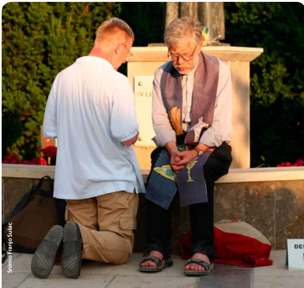
Snimio Franjo Sušac