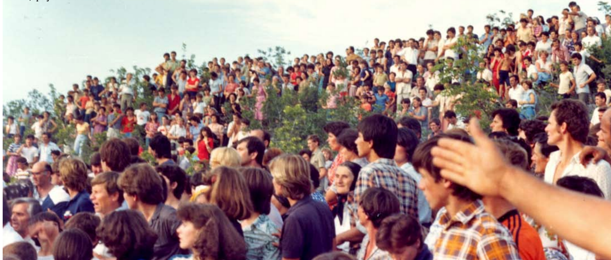
Podbrdo, lipanj 1981.

Gospa naša, Majko naša Kraljice Mira, moli za nas neznatne i grješne!