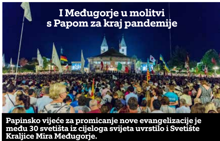
Papinsko vijeće za promicanje nove evangelizacije je među 30 svetišta iz cijeloga svijeta uvrstilo i Svetište Kraljice Mira Međugorje.

Papa molitvom krunice otvorio molitveni maraton za kraj pandemije Trideset svetišta iz cijeloga svijeta svakoga će dana u svibnju moliti krunicu za završetak pande- mije, u okviru molitvenoga maratona na temu: Crkva se svesrdno moljaše Bogu (Dj 12,5).