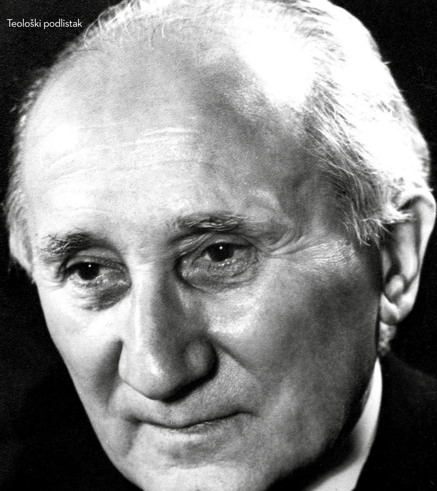
Romano Guardini o Isusu Kristu