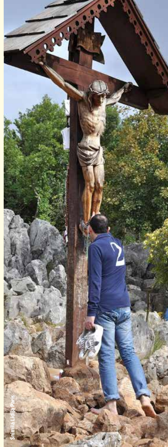
Snimila Ljudia Paris

Cijena sretne obitelji je umiranje sebi. Otac mora umrijeti ako želi dati život svojoj supruzi i djeci. Iako ova pomisao možda nije ugodna, ona je svakako istinita. Moguće je provesti čitav život izbjegavajući je. Jednostavno nije dovoljno osiguravati sve potrebno za život i štiti ga. Razumije se da su zaštita i osiguravanje potrebnoga same po sebi valjane i nužne stvari. To je naša odgovornost. No, otac svojoj obitelji može osigurati čitavu gomilu materijalnih stvari i braniti je od najrazličitijih nevolja misleći da može biti miran jer je obavio svoju dužnost, a da pritom zapravo propusti ono bitno: pozvan je biti slikom ljubavi i istine Očeve. Kuća koju je podigao, bila ona koliba ili palača, u svojoj jezgri mora imati srce koje moli, srce spremno uvidjeti vlastitu bijedu, srce dovoljno ponizno kako bi zavapilo za pomoć. Bog ispunjava posudu koja priznaje da je prazna i otvara se primanju stvarne snage. Sve dok se pouzdajemo u vlastite snage, pamet i lukavu sposobnost izdržavanja, mi-