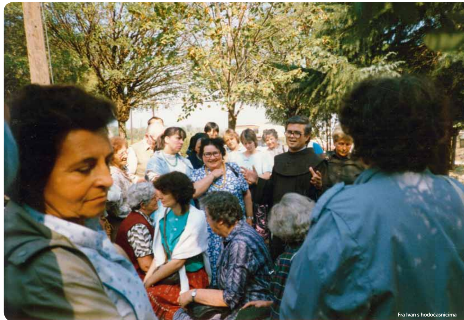
Fra Ivan s hodočasnici