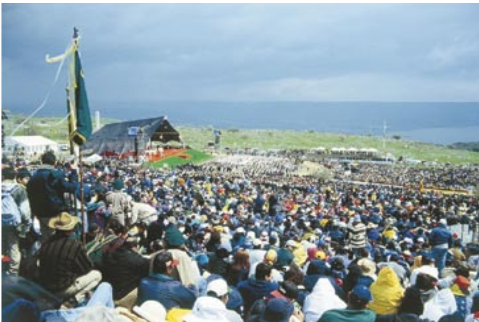
Papa Ivan Pavao II. slavi svetu Misu na Brdu blaženstva god. 2000. Nazočno je bilo više od 100 tisuća vjernika. U pozadini Genezaretsko jezero. Najveći skup vjernika u Svetoj zemlji dosada!

Svaki čovjek ima svoje nadnaravno poslanje, on nije stvoren samo za ovu zemlju. O tome govori i Marija ovdje među nama, kako vele vidioci. I zašto ne slijediti glasove koji donose svijetu sreću i smisao? Marija je na strani života i zato to uporno naglašava ovdje. Treba biti ovdje u Međugorju i doživljavati drame osoba koje su se ogriješile o život, napose onaj nerođeni.