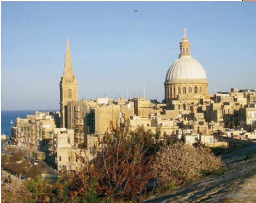
La Valetta, glavni grad Malte

Sa svojim medicinskim i socijalnim ustanovama raširen je u 120 zemalja. Pomaže bolesnima, siromašnima i unesrećenima. Pruža pomoć sukobljenim vojskama i ljudima pogođenim prirodnim katastrofama. Osposobljava mlade da mogu drugima pomagati. U ovu vrstu služenja uključeno je 12.000 članova, 80.000 dragovoljaca i 11.000 plaćenog osoblja, uglavnom liječnika. Većina bolnica Reda nalazi se u Europi.