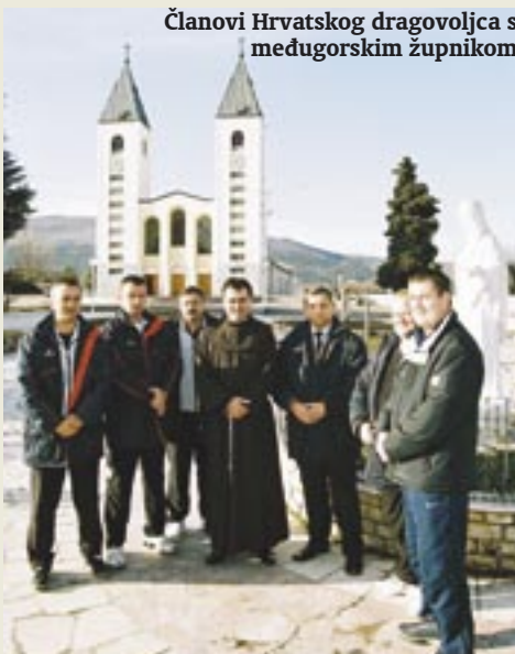
Članovi Hrvatskog dragovoljca s međugorskim župnikom

U Međugorju je Hrvatski dragovoljac proveo deset dana pripremajući se za nastavak nogometnog prvenstva.