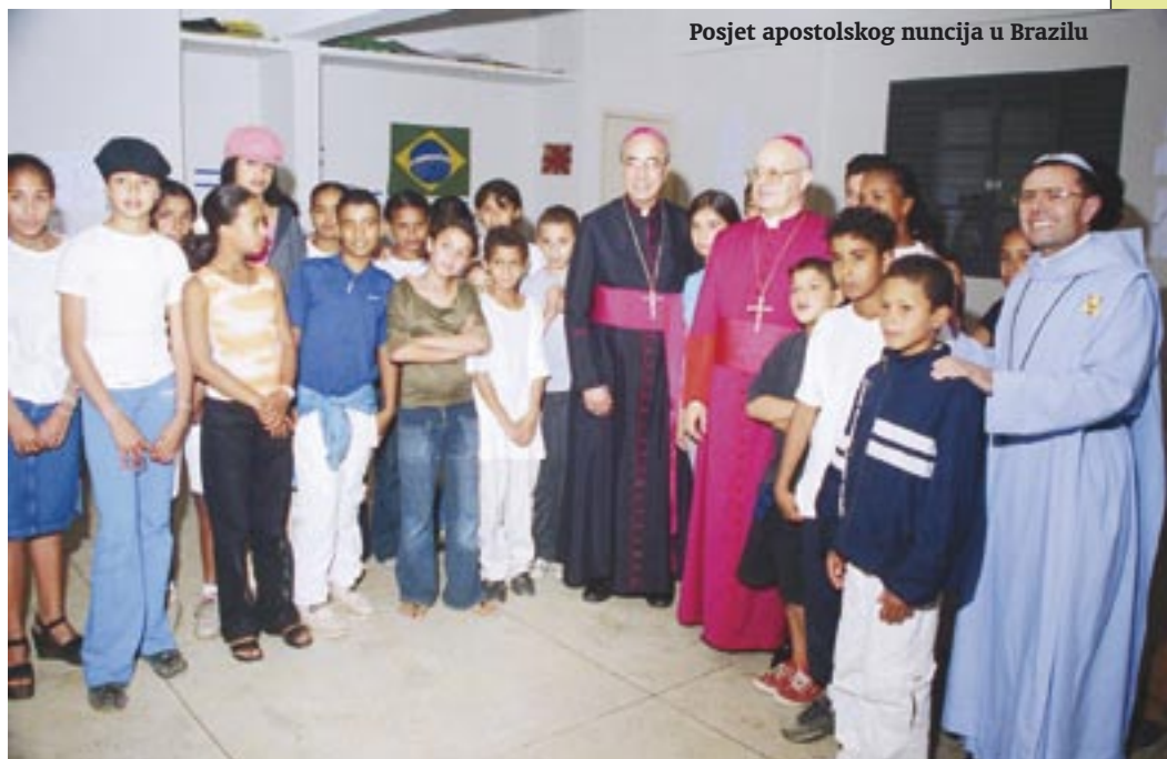
Posjet apostolskog nuncija u Brazilu