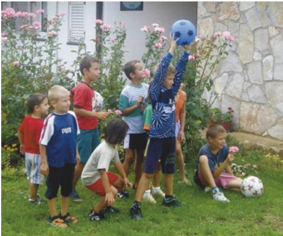
Majčino selo u Bijakovićima

Gospa svojom milošću opet dotakne njegovo srce, produbi vjeru, ražari ljubav, učvrsti nadu.