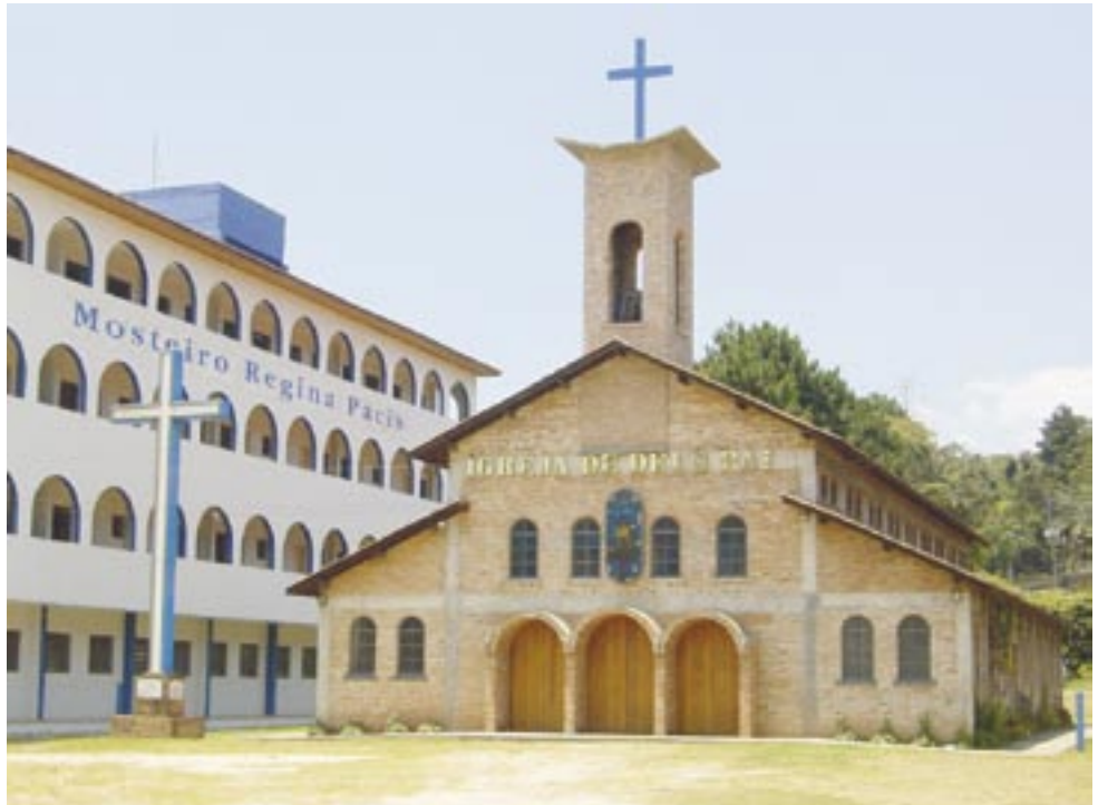
Samostan Kraljice Mira i crkva Boga Oca

Sutradan ujutro, poslije jednostavnog doručka koji su nam svakog jutra pripremali