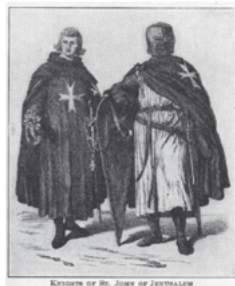
KNIGHTS OF ST. JOHN OF JERUSALEM

Poslije šest mjeseci opsade i teških borbi s jakom morską flotom i nadmoćnom