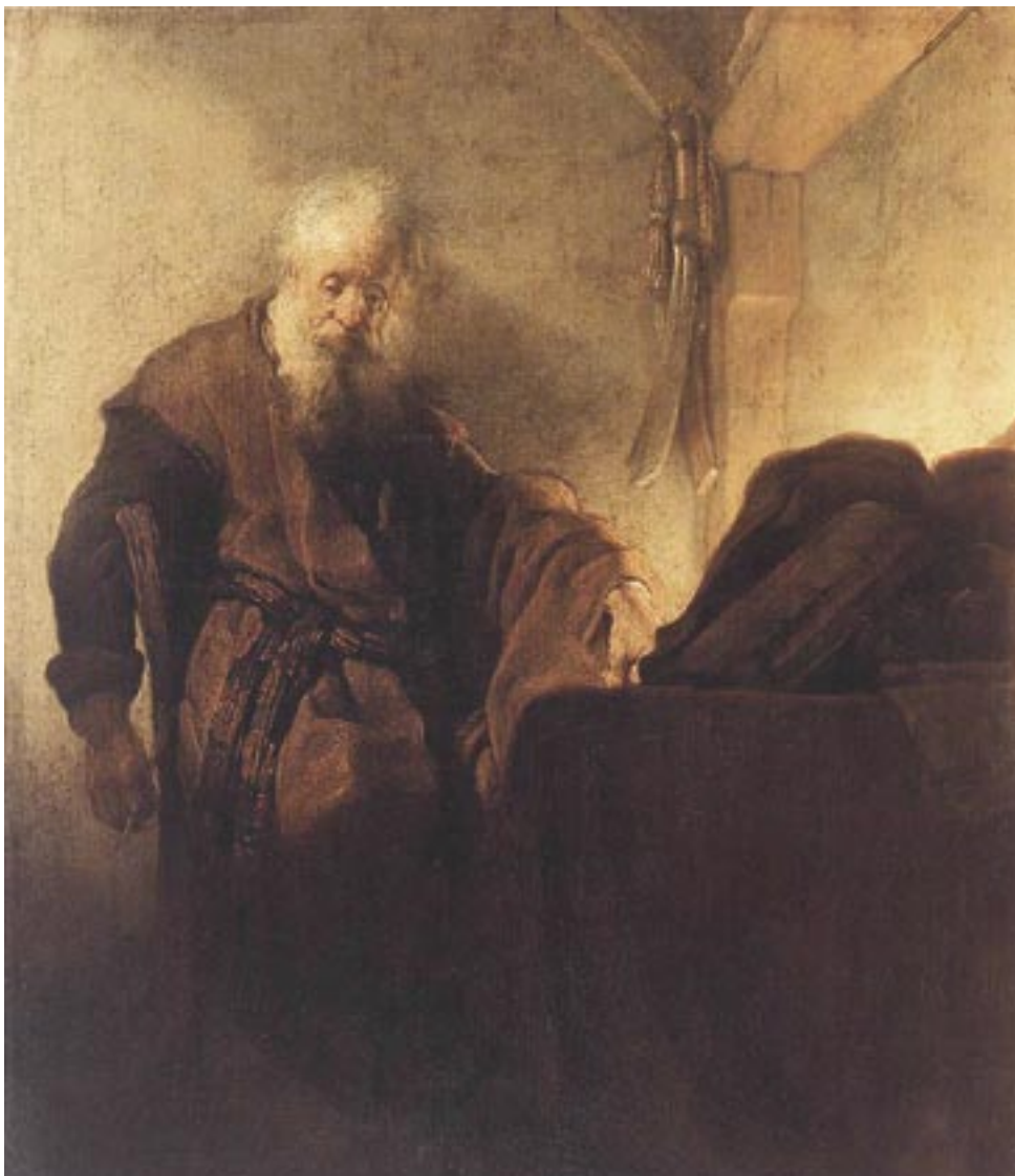
Rembrandt, Sv. Pavao za radnim stolom

Nije slučajno ni to što je ovdje Marija zamijenjena općom imenicom “žena”. U izrazu “rođen od žene” treba gledati semitski izraz koji ima najbližu paralelu u Isusovoj riječi o Ivanu Krstitelju: “Između rođenih od žene nije ustao veći od Ivana Krstitelja” (Mt 11,11; Lk 7,28). Prema tome, “rođen od žene” znači jednostavno “ljudsko biće”, “čovjek”. I upra-