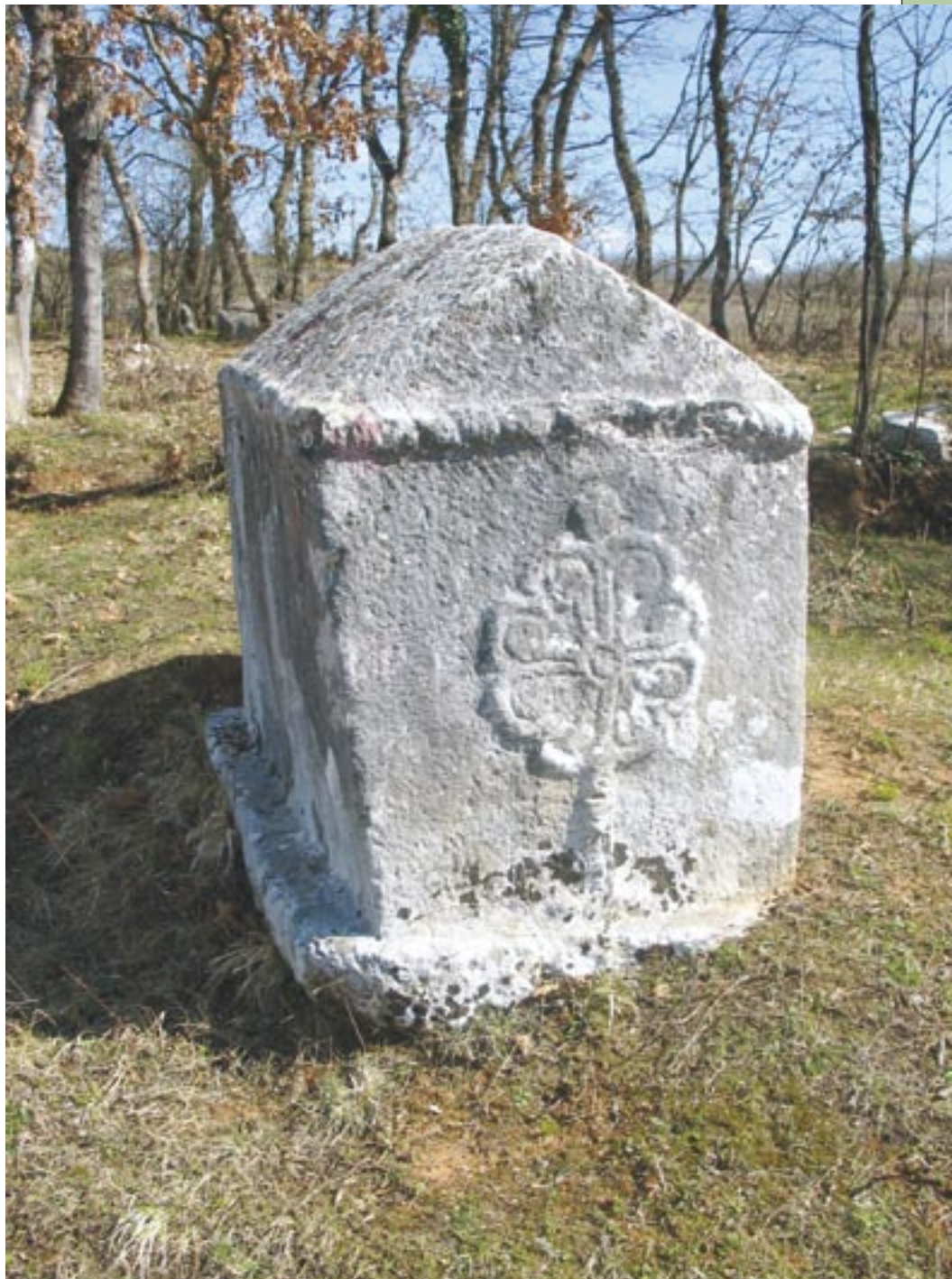
Stećak na Vionici

Tako je čitava (današnja) Hercegovina ostala bez i jednoga franjevačkog samostana (samostan u Konjicu bio je uništen još 1524., a franjevci okrutno pobijeni: bili su obješeni na most preko Neretve u Konjicu, a tijela su im dugo vremena ostala visjeti kao opomena preostalim katolicima). Ipak, i nakon napuštanja područja (današnje) Hercegovine franjevci nisu napustili preostali katolički puk na tome području. Ljubuški su se franjevci iz Zaostroga brinuli za puk za koji su skrbili dok su bili u Ljubuškom. Slično su zaostroški franjevci brinuli za katolike koje su nekoć pastorizirali iz mostarskog samostana, dakle za Mostar i okolicu, Mostarsko blato i Broćno. Preostali dio današnje Hercegovачke franjevačke provincije služen je iz samostana u Imotskom (današnja Bekija) i Rami (duvanjski kraj). Drugih pastoralnih radnika u Bosni i Hercegovini osim franjevaca već odavno nije bilo.