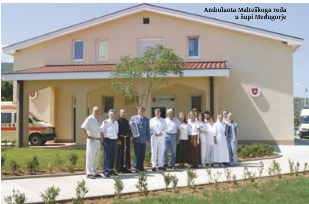
Ambulanta Malteškoga reda u župi Međugorje

Vitezovi su polagali zavjete siromaštva, čistoće i poslušnosti. Njihov znak je Ivanov križ s osam vršaka koji simboliziraju osam blaženstava i u isto vrijeme upućuju na duhovno poslanje Reda. Uz bolničku službu bili su dužni vojnički braniti kršćanstvo.