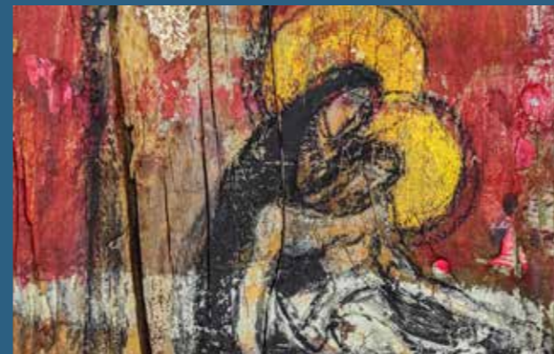
Fotografija na naslovnici: Karin Grenc, Pietà