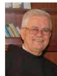
FRA IVAN DUGANĐIĆ

Isus je već svojim čestim povlačenjem na molitvu zasigurno bio poticaj učenicima da i sami mole. Uz to, hrabrio ih je da u molitvi budu postojani i ustrajni i da ne sumnjaju u uslišanost svoje molitve. Pripovijedajući o prijatelju koji će i usred noći ustati i izići u susret prijatelju koji ga moli za pomoć, Isus želi reći da se Otac nebeski ne da ni od koga nadmašiti u darežljivosti (Lk 11,5-13). Ako je sirota udovica svojom upornom molbom u stanju smekšati bezbožnog suca, koliko će više ustrajni molitelj ganuti Božju dobrotu da mu se smiluje (Lk 18,1-8). No puno je važnije što im je u tekstu Očenaša ostavio uzor prave molitve. Luka je zabilježio da je Isus tu uzvišenu molitvu učenicima povjerio na njihov vlastiti zahtjev, nakon što su promatrali kako on sam moli: Kako je molio na nekom mjestu pa prestao, reče mu jedan od njegovih učenika: 'Gospodine, nauči nas moliti, kao što je i Ivan naučio svoje učenike!' (Lk 11,1).