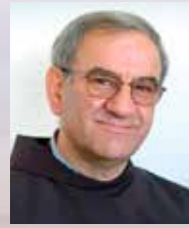
FRA TOMISLAV PERVAN

Bogotražiteljica, mističarka i umna žena Simone Weil (1909.-1943.) bijaše iznimna pojava u prvoj polovici dvadesetoga stoljeća. Sjetili smo je se u božićnom prilogu našega glasila. Kao Židovka bježala je iz Francuske pred nacistima, skrasila se u New Yorku, mogla ondje dobiti sveučilišnu stolicu, biti predavač filozofije, ali se toga svjesno odrekla. Vratila se natrag u Europu kako bi dijelila u svemu nevoljnu sudbinu svoga naroda, s njim suosjećala, do kraja, u agoniji koju je proživljavao pod nacističkim režimom. Preminula je ne navršivši ni 34. godinu života, dakle, u naponu snage, u Isusovoj dobi; do kraja iscrpljena, izgladnjela, od sušice koju je „zaradila“ izgladnjivanjem. Oduševljavala se kršćanstvom, Kristom, ali je ostala negdje na pragu Crkve. Spomenuli smo kako je, kad je već bila na izmaku snaga, uoči same smrti, zamolila prijateljicu da je dovede pod slavinu, pusti vodu po njezinoj glavi i izgovori riječi krštenja, Presvetoga Trojstva, u čije se ime krštavamo. Tako je prema svjedočanstvu prijateljice ipak stupila u Kristovu Crkvu.