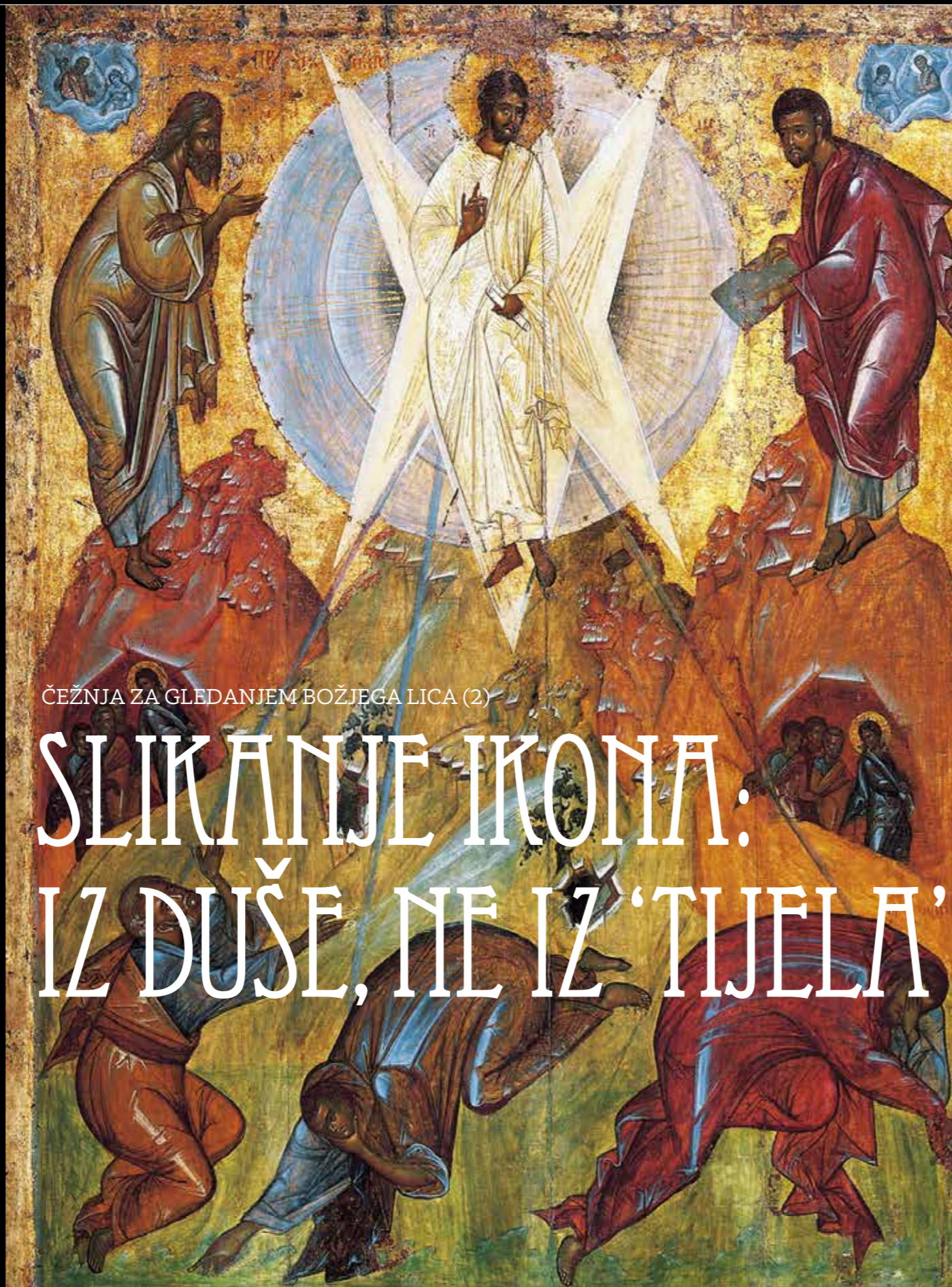
ČEŽNJA ZA GLEDANJEM BOŽJEGA LICA (2)

Ilustracija: Kristovo preobraženje, ruska ikona, 15. st., često slikana ikona na području Bizanta, Rusije, istočnog Balkana, Mediterana i Jadrana, važna za pristup slikanju, čitanju i razumijevanju ikona.