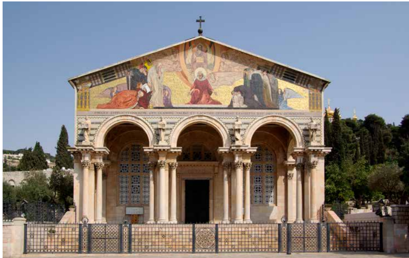
Crkva sviju naroda

Nadalje, jedino Ivan i Luka (Luka ovisio o Ivanu) spominju kako je Petar odsjekao desno uho sluzi velikoga svećenika. Drugi samo spominju uho. Ivan, koji je vrsni poznavatelj Pisma, zna da to ima svoju simboliku. U Knjizi Izlaska, u tzv. ceremonijalu ređenja za svećenike, čitamo: Sad ovna zakolji; uzmi mu krvi i njome namaži resicu desnoga Aronova uha (Izl 29,20). Dakle, ostati bez desnoga uha značilo je ostati bez svećeništva. Drugim riječima, niti sluga velikoga svećenika koji je u vrtu ostao bez uha više ne može biti svećenik, jer starome svećeništvu došao je kraj. Na njegovo mjesto dolazi Isus, čija krv prolivena na križu budi paloga Adama i daruje mu novi život, a u njemu i svima nama. A u Getsemanskom vrtu Isus je prihvatio, u času odlučne borbe, kalež koji je ispio do kraja. Isuse, hvala ti!