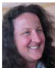
MILONA VON HABSBURG

U OVE TIHE ZIMSKÉ DANÉ OKRUŽENI SMO TIŠINOM. Priroda nas potiče da zavirimo u svoju dubinu. Božićno je vrijeme iza nas; vrijeme je korizme.