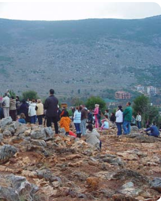
Sestra Petra s djecom

S eminari posta, molitve i šutnje na hrvatskom jeziku u 2007. godini održat će se u sljedećim terminima: 18. do 24. veljače; 15. do 21. srpnja; 09. do 15. rujna; 25. studenoga do 1. prosinca.