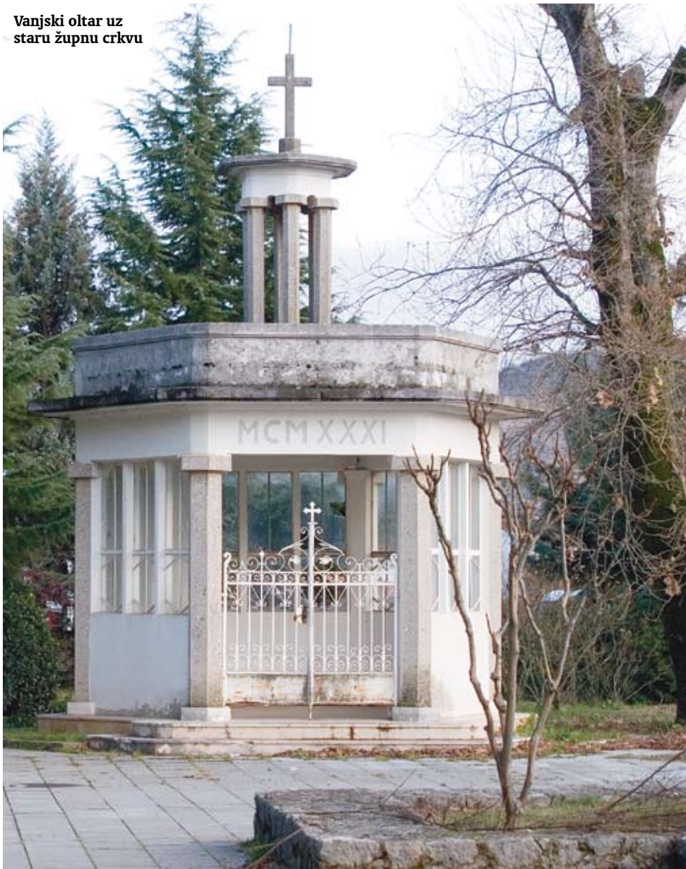
Vanjski oltar uz staru župnu crkvu

Župnik fra Bernardin iscrpno je opisao gradnju spomen-križa kao i darovatelj. Izvornik toga spisa čuva se u župnom uredu u Međugorju, a kopija u Arhivu Hercegovačke franjevačke provincije. Ideju o izgradnju