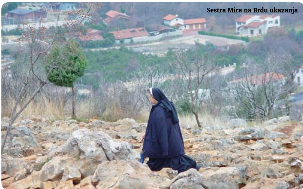
Sestra Mira na Brdu ukazanja