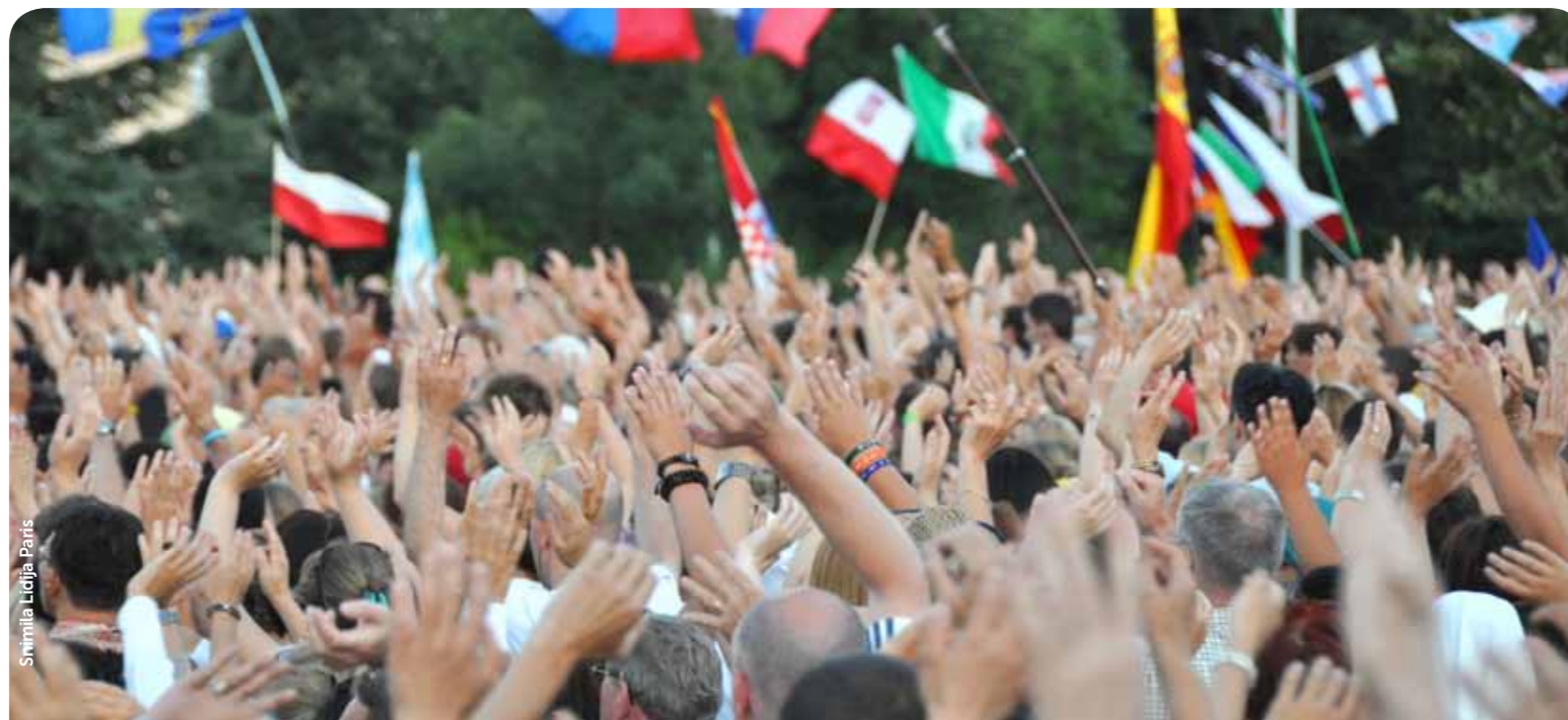
Swimila L. L. L. Paris

Pastiri su primjer otvorene duše koja prima Boga kao što siromah prima krišku kruha. Oni su stvarno siromašni, ali međusobno vrlo solidarni. Imaju, dakle, sve ono što je preduvjet istinske kršćanske vjere. A kršćanska vjera znači život čovjeka koji hodi s Bogom, koji je potpuno otvoren Bogu, svjestan da je potpuno ovisan o Bogu, usidren u Bogu... Vjera ne susreće Boga kao „prvo počelo“, „prvi uzrok“, „bitak naprosto“, nego kao Boga živoga, milosrdnoga, Boga koji ljubi čovjeka, koji se želi s čovjekom združiti. Takva vjera čini svaku stvar svetom, preobražava ljude, poziva ljude da s Bogom surađuju, da među ljudima stvaraju zajedništvo u bogatstvu i siromaštvu, da promičemo pravdu, da pomažemo bližnjima. To nas uče betlehemske pastiri, to nas uči betlehemska dijete, to nas uči i Blažena Djevoja Marija. Zato nas ona poziva da ozbiljno shvatimo ovo milosno vrijeme koje nam Bog nudi za spasenje.