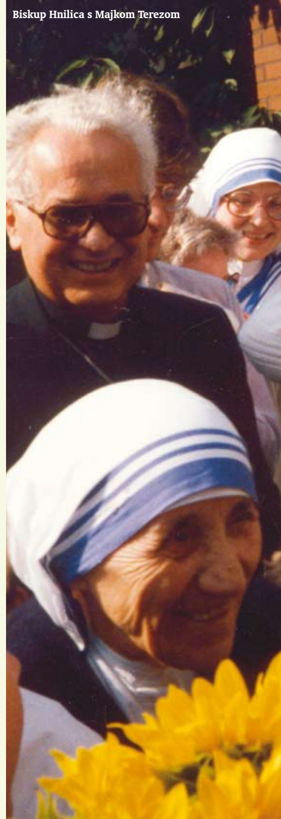
Biskup Hnilica s Majkom Terezom

Stoga što to izražava kolegijalnost Crkve, drugim riječima, jedinstvo biskupa sa Papom, koje tomu daje daleko dublje značenje. Kada je 1978. Karol Wojtyła izabran za papu čestitao sam mu, ali sam ga odmah upozorio da će njegovu pontifikatu nešto nedostajati ukoliko zajedno sa svim biskupima ne posveti Rusiju. Tada mi je rekao: »Ako uspiješ uvjeriti biskupe u to, učinit ću to već sutra«. Poradi toga me je nakon posvećenja 25. ožujka 1984. upitao koliko je biskupa sa mnom koncelebriralo. S obzirom da mu nisam mogao odgovoriti, Papa je kazao: «Svaki biskup treba pripremiti svoju biskupiju, svaki svećenik svoju zajednicu, svaki otac svoju obitelj, jer je Gospa rekla da se i laici trebaju posvetiti njezinom Srcu».