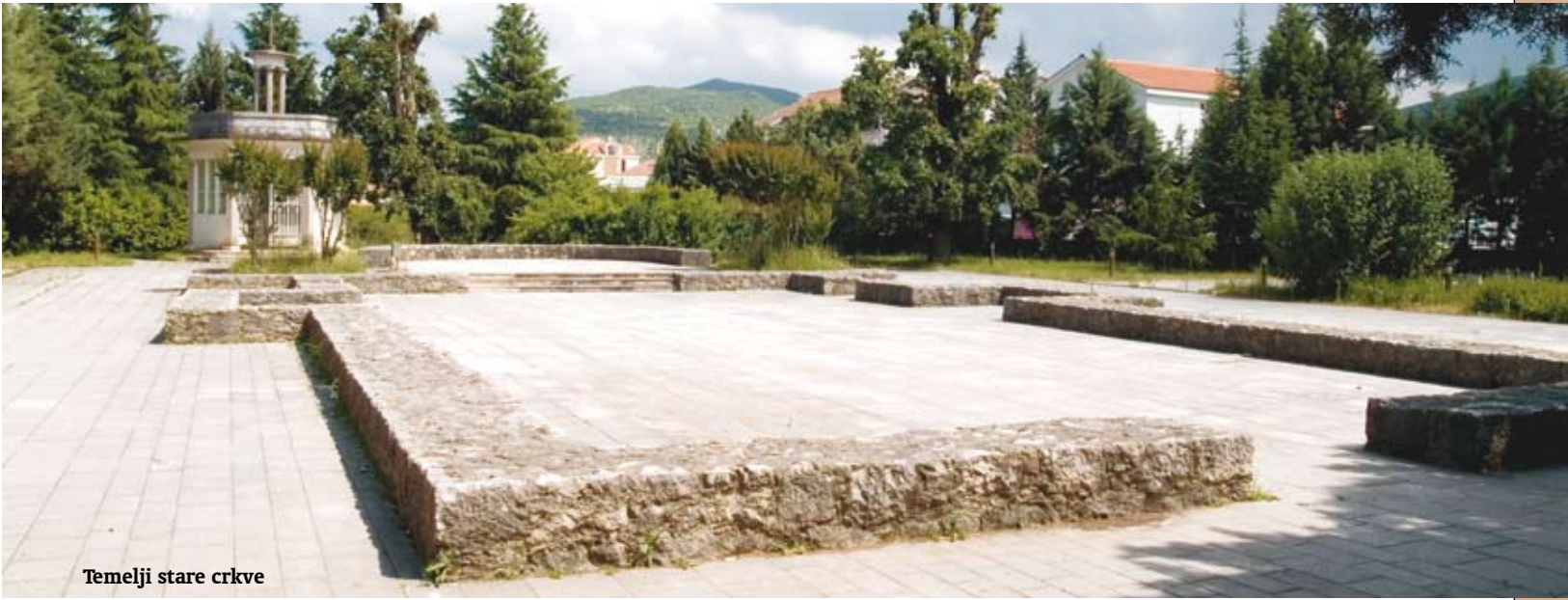
Temelji stare crkve

dvostruko više nego prije 35 godina. I inače je u čitavoj Hercegovini to vrijeme na razmeđu 19. i 20. stoljeća vrijeme najbržega rasta katoličkoga pučanstva.