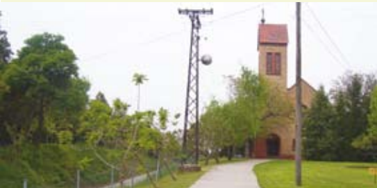
Crkva u župi Male Pijace

U mađarskoj seoskoj župi sv. Petra i Pavla u mjestu Male Pijace u Vojvodini živi oko 2000 duša. U crkvi se svakog četvrtka navečer održava klanjanje pred Presvetim. Molitvene meditacije prate se iz Međugorja zahvaljujući Radio Mariji iz Novog Sada koja se uključuje u prijenos koji osigurava Radiopostaja „Mir“ Međugorje. Ako u Međugorju nema prijevoda na mađarski, prevodi se iz studija u Novom Sadu.