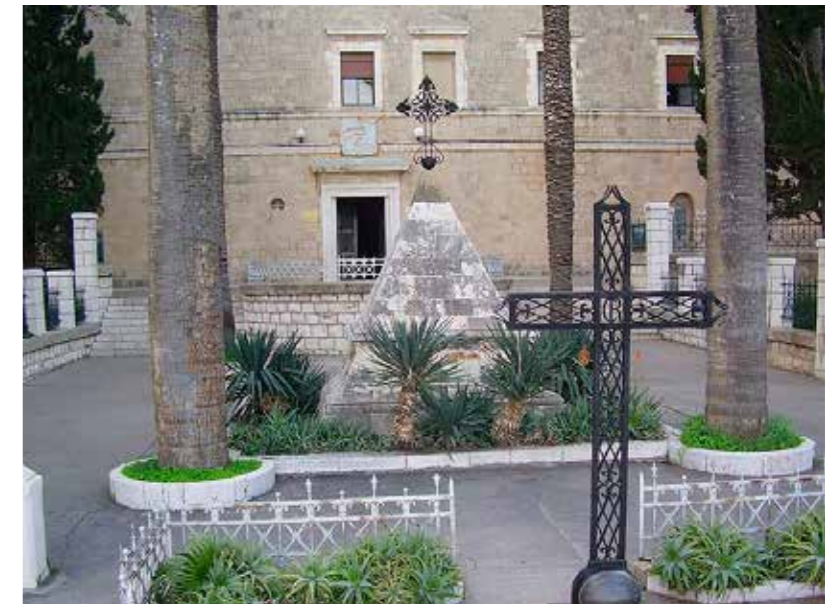
Piramidalni mauzolej posvećen poginulim vojnicima za Napoleonova vremena

Svima nam je poznata borba proroka Ilije s baalovim svećenicima, koja se upravo odigrala na Karmelu (1 Kr 18,21.40), što govori ne samo o mjestu na kojemu su boravili sv. Ilija i njegov nasljednik Elizej sa svojim proročkim sinovima, nego i o prisutnosti poganskoga kulta kroz duga povijesna razdoblja. U kršćanskom razdoblju nastavilo je biti mjestom monaštva i pustinjaštva. Tako za vremena križara upravo ovdje nastaju Karmelićani. Nakon što su se razbježali od Saracena, ponovno stižu na Karmel u 18. st., gradeći samostan i crkvu Djevice Marije i sv. Ilije. Vrijeme njihova konačnog povratka bilo je također turbulentno, pa svoje lijepo zdanje nisu mogli dovršiti u jednom koraku, nego tek stoljeće kasnije. Tako su za vremena Napoleonova pohoda na ovom području njegovali njegove ranjene vojnike, za što su se njegovi protivnici krvnički osvetili ubijajući ih, o čemu svjedoči piramidalni mauzolej što ga nalazimo ispred same crkve. Ona, pak, u sebi nosi uspomenu na proroka Iliju, jer se ispod oltara nalazi pećina u kojoj je slavni prorok boravio, ali i na Gospu Karmelsku, ili bolje, Zvijezdu mora – Stella maris – kojoj je upravo posvećen oltarski prostor s njezinim kipom izrađenim od libanonske cedrovine. Crkvom dominira prekrasna kupola oslikana raznim motivima: Marijinih okrunjenjem, Ilijinim uznesenjem u nebo, predajom plašta Elizeju, te Svetom obitelji. Posebno mje-