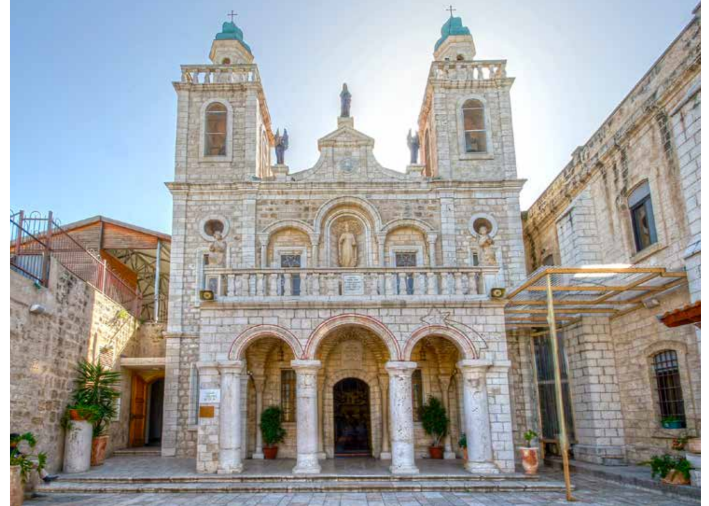
Crkva svadbe u Kani Galilejskoj

Marijo, Zvijezdo mora i Posrednice milosti, moli za nas!