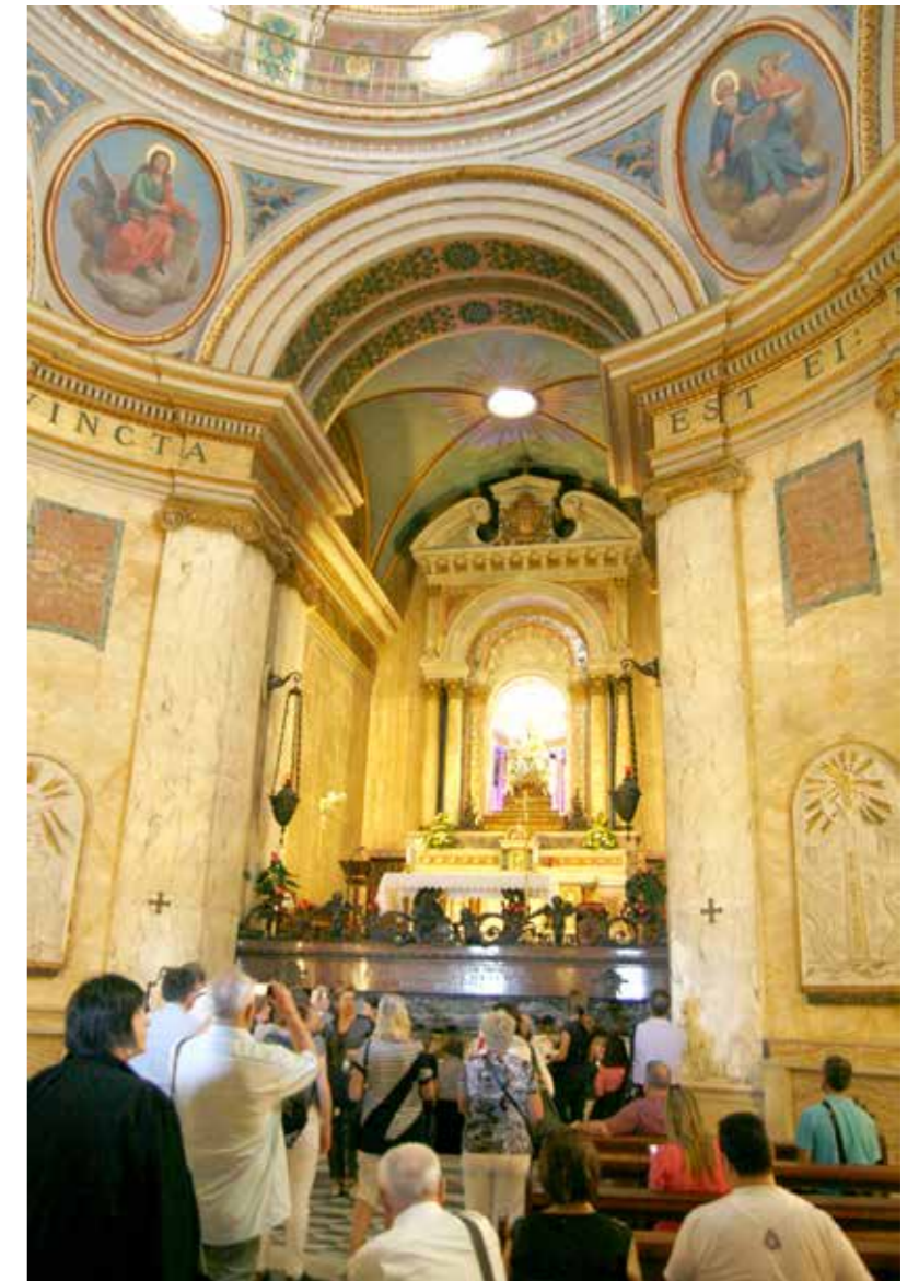
Unutrašnjost crkve Stella maris