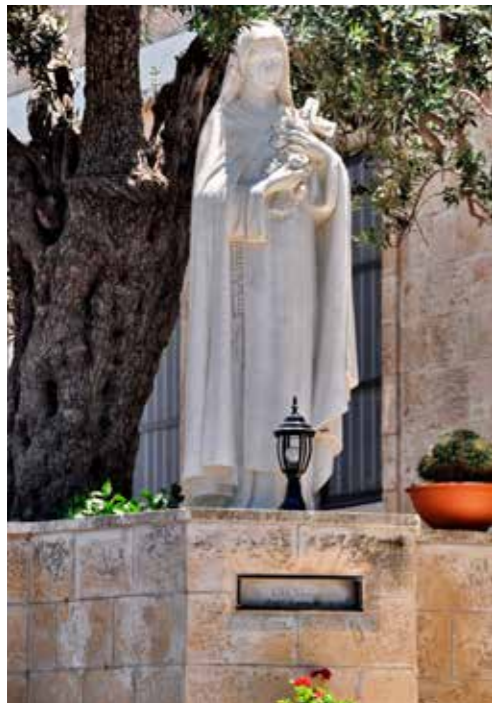
Kip sv. Tereze Avilske

sto u crkvi zauzimaju i veliki karmelski mističari: sv. Ivan od Križa, sv. Terezija Avilska, sv. Edith Stein te Mirjam Baouardy. Zanimljiv je i nastanak naziva „Stella maris“ – Zvijezda mora – što ga koristimo za Blaženu Djevicu Mariju. Naime, naš sv. Jeronim je želio protumačiti samo Marijino ime, „Marjam“, na hebrejskom. Ono bi značilo „morska kap“, na latinskom „Stilla maris“. Kada je neki prevoditelj prepisivao Jeronimov rukopis, umjesto „Stilla“ napisao je „Stella“ – zvijezda, pa smo tako dobili jedan litanijski zavij posvećen Gospi.