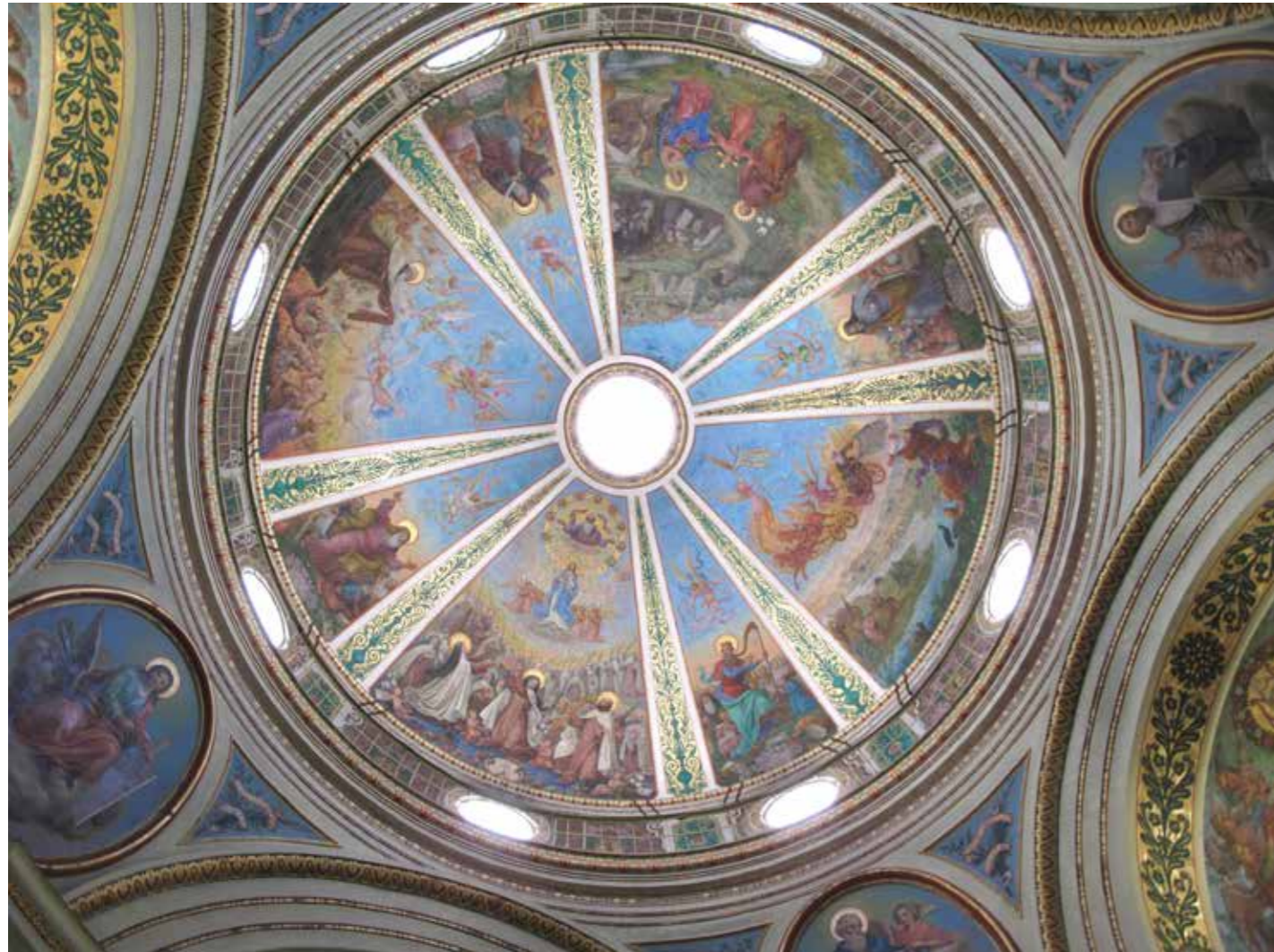
Kupola s motivima Marijinog okrunjenja, Ilijinog uznesenja u nebo, predaje plašta Elizeju te motivima Svete obitelji