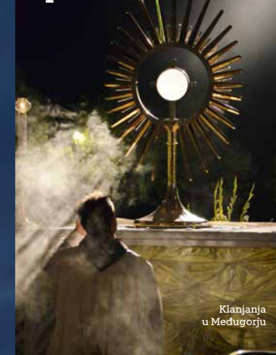
Klanjanja u Međugorju