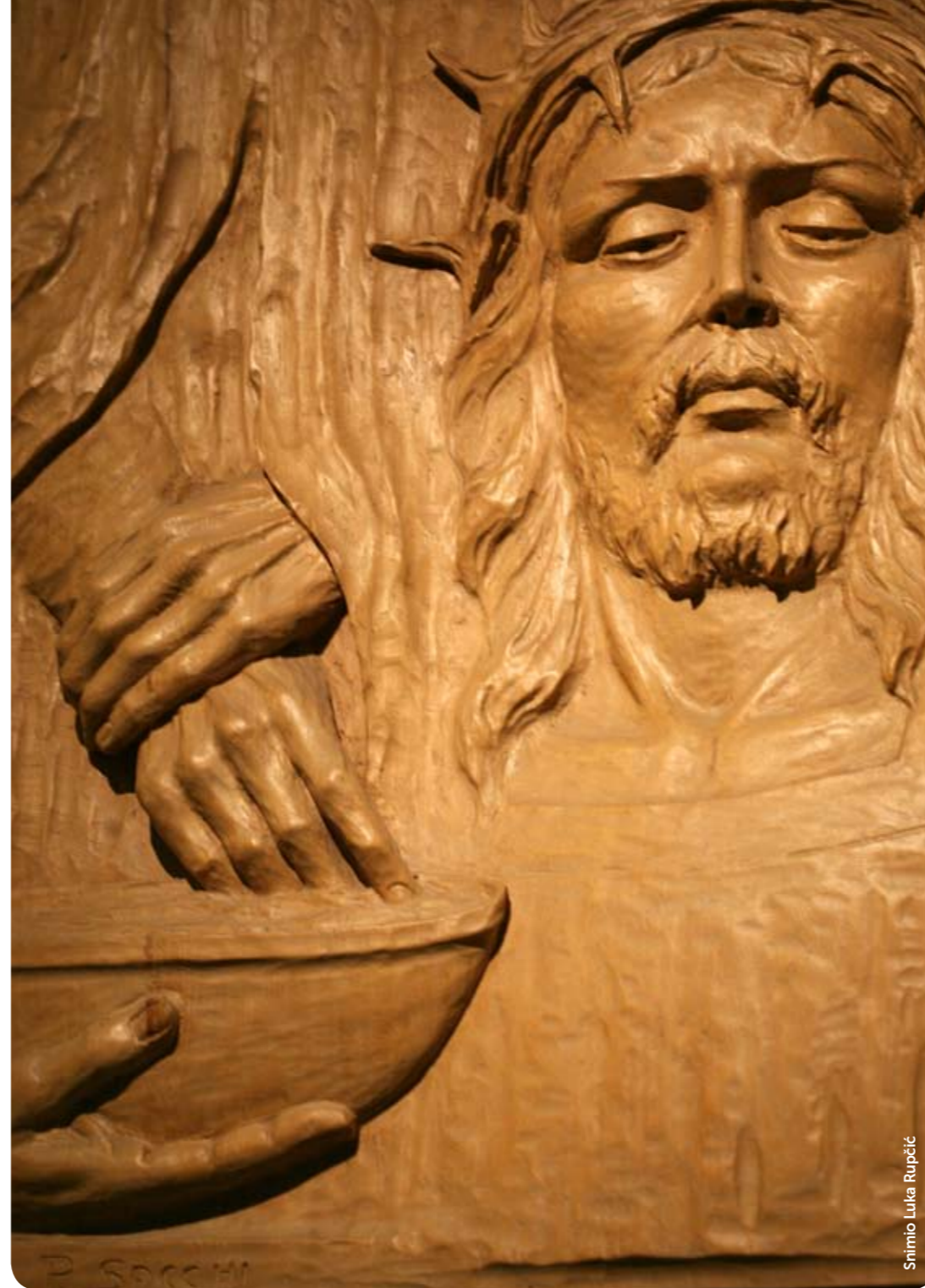
Srimio Luka Rupčić

Baciti oganj na zemlju: Isus htjede donijeti prevrat svih postojećih pokušaja svrstavanja ljudi na dobre i zle, pobožne boguugodnike i prokletnike, časne i nečasne, čestite i kužne. Razlučna pak crta prolazi kroz svači-