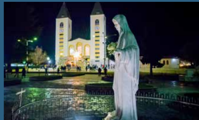
Fotografija na naslovnici.