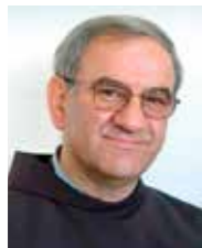
FRA TOMISLAV PERVAN

Svaka nova godina novi je početak i zametak. Nova klica koja se polaže u zemlju da bi izrasla u biljku, u stablo. U svemu što se sije – ako je sjeme zdravo – postoji nada novoga početka, nada budućnosti, vizija novoga života i stvaranja. Iz povijesti možemo mnogo toga naučiti. Napose iz povijesti spasenja, koja je uvijek povijest uspona i padova, povijesnih plima i oseka, grijeha i smilovanja, nade i budućnosti. Prepun je toga Stari zavjet, a u Isusu Kristu položena je u temelje svijeta nova nada, novo stvorenje. Povijest Crkve svjedoči zorno o tome. Treba samo otvoriti oči srca i duha te iščitavati Božje znakove na povijesnome hodu.