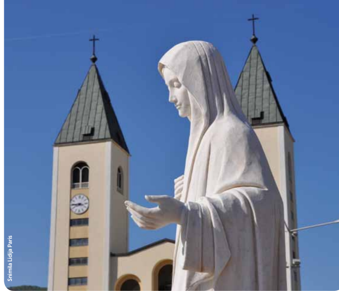
Shimila Liojija Paris

Kada tu ne bi bila riječ o nečem zahtjevnom i izazovnom, na što se ne može ostati ravnodušan, teško da bi bilo tolikog otpora. A kad bi to izazovno dolazilo od ljudi a ne od Boga, trideset godina bilo bi i predugo vrijeme da se to pokaže. Ako se to nije dogodilo i ako Međugorje, unatoč svemu blatu kojim se na nj nabacuje sve više i više privlači pozornost ljudi, to je razlog više da se treba njime baviti.