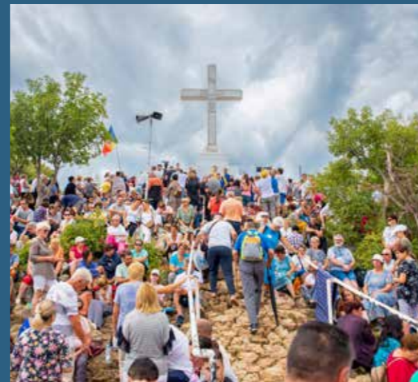
Fotografija na naslovnici. Arhiv ICMM