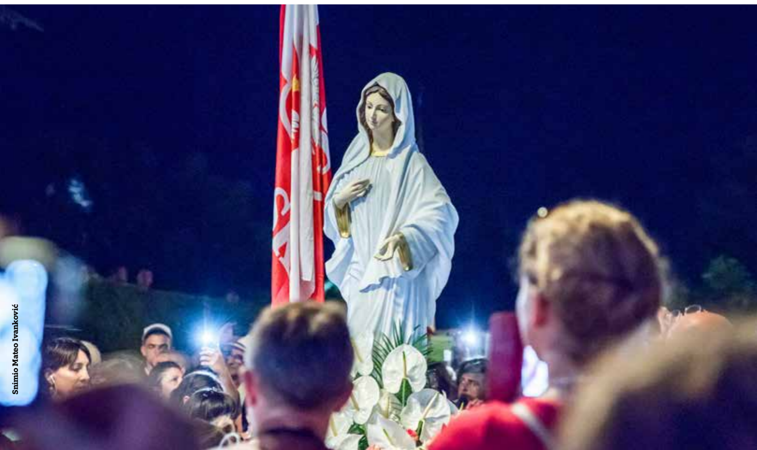
Snimio Mateo Ivanković

Kod nekih teologa Marija je puki „inkubator“ za Sina Božjega. Trebala je Isusa roditi, i s tim svršava njezina uloga. Nakon što je Isusa rodila, ona je obična žena iz puka, u Nazaretu. Zanemaruju se bitne protežnice i novodobne spoznaje vezane uz dijete u majčinu krilu. Trudnoća bitno mijenja majku-ženu upravo zbog djeteta koje u njoj raste. Smijemo tvrditi kako je Sin Božji promijenio Marijnu ontologiju i bit, svojim božanstvom koje je zadržao i u njezinu krilu te time djelovao iznutra na vlastitu majku.