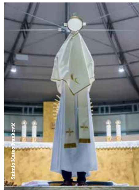
Siniša Mateo Ivančević

Kao i inače, molila se krunica, a bogato misno slavlje predsjedao je fra