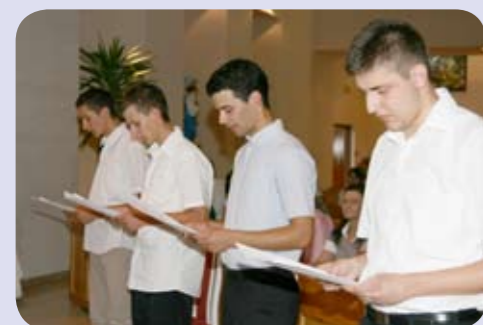
Snimio fra Dražan Boras