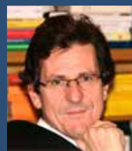
FRA ANTE VUČKOVIĆ

Što se događa u Međugorju? Ukazuje li se stvarno Gospa, Isusova majka ili netko drugi? Ili je sve samo obmana? Ili možda još i gore: zlonamjerna prijevara? Ova su pitanja stara koliko i međugorska događanja sama. Sumnja u nadnaravnost međugorskih ukazanja sada je, međutim, dobila i svoj jasniji opis koji dolazi iz vrha Katoličke Crkve, ako su mediji doista točno prenijeli riječi pape Franje. Prvih bi sedam ukazanja bilo nadnaravno, ali to još treba dodatno proučavati, a u ostale postoji velika sumnja. To proizlazi iz dokumenta povjerenstva koje je osnovao papa Benedikt XVI, a kojemu je na čelu bio kardinal Ruini. To je dokument koji bi trebao pomoći Papi da donese svoj sud. Svoj službeni stav papa Franjo još nije oblikovao, ali on je novinarima u zrakovu, na povratku iz Fatime gdje je slavio 100. obljetnicu ukazanja, govorio o dijelovima izvješća povjerenstva. Dao je naslutiti kako postoje napetosti među različitim strujama u Vatikanu, ali i kako on osobno sumnja u ukazanja i poruke, ponavljajući svoju usporedbu kako Gospa nije poštarica da bi svakoga dana slala poruke i naručivala ukazanja.