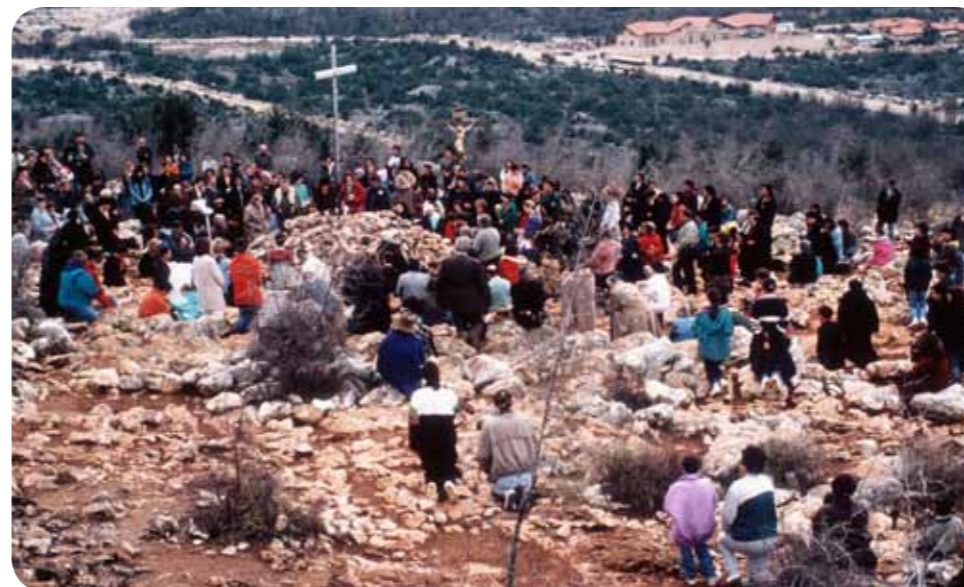
Na Podbrdu kod Majke

Kroz prozor sam često pogledala ima li žive duše da vidi ovaj naš dan. Bože, nigdje nikoga! Toliki ljudi, hodočasnici, kao da su u zemlju propali. Nigdje nikoga od naših Međugorčana... Dječji su glasovi umuknuli. Vinogradi i duhaništa stajali su napušteni. Tek ponegdje se mogao zamijetiti pokoji čovjek... Mi nismo znale da je sve uokolo blokirano, da hodočasnici nisu mogli dalje od mosta na Lukoću. Mladi iz Jablanice i Mostara koji su sa svojim svećenicima došli Majci Kraljici Mira, morali su satima stajati na mostu i gledati svoju crkvu. Njihov je dolazak, naredbodavcima iz Sarajeva,