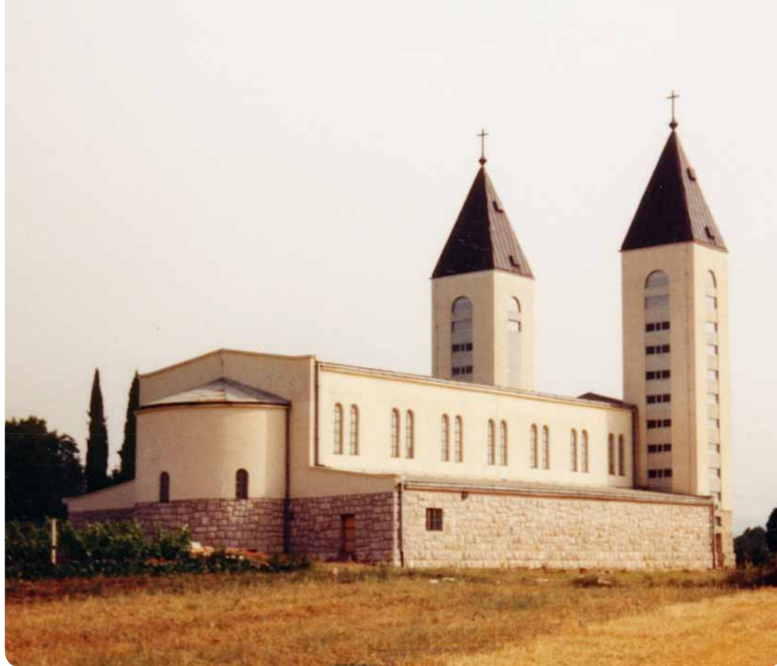
Župna crkva u prvim danima ukazanja

Ne ću se suviše osvrtni – premda su mi osobno najviše smetali – na banaliziranja i površne pristupe, osobito braće svećenika, stiješnjene u tipično ljudske okvire i opterećene raznim odnosima koji se vrte u krug. Tko bi pobrojio situacije u kojima je blagoslov ostao bez odgovora, u kojima je na molitve uzvrćeno sumnjom! U vatrometu suprotnih, pa i teških (izgovorenih i napisanih) riječi, mnogo je mjesta za istraživanje. Osjećam se sretnim kad shvatim sigurnost ponekog odgovora u sebi. Predajem se i odustajem od prebrojavanja milosti. To je nemoguće, možda i nepotrebno. A tko ima dovoljno nurnje bistrine da o svemu zbori? Neka Bog naše misli ostavlja otvorenima dok ne sazre naše življenje u Bogu. Trebamo, kao i na po-