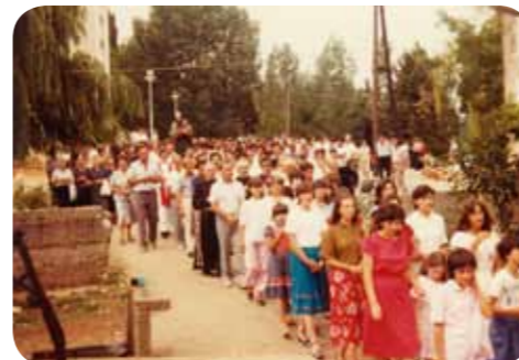
Procesija na blagdan sv. Jakova, 25. srpnja 1982.

Najveće plodove Međugorja vidim u ljudima koji su se ovdje promijenili. Sama je Gospa u jednoj svojoj poruci kazala da je najsretnija zbog onih koji su ovdje promijenili svoj život, koji su ponovno pronašli Boga, koji su ponovno počeli vjerovati i moliti. To su najveći plodovi, ljudi koji su se nakon dvadeset, trideset ili četrdeset godina ovdje ispovjedili. Kad je riječ o nama župljanima, svi se sjećamo s kolikim smo žarom prihvatili molitvu i vjeru; bili smo spremni sve učiniti za Boga, Gospu i vidioco i bilo bi mi drago da ponovno budemo takvi jer kao župa možemo više učiniti. Taj dar koji smo od Boga primili velika je odgovornost jer preko njega Bog želi promijeniti cijeli svijet te, stoga, kao župa moramo svojim životom zahvaliti za ono što je Gospa ovdje dala.