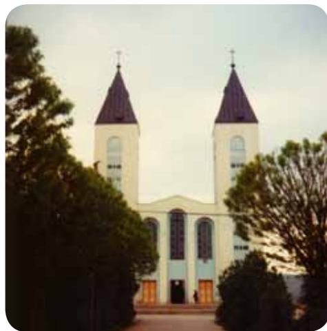
Crkva, 25. travnja 1982.