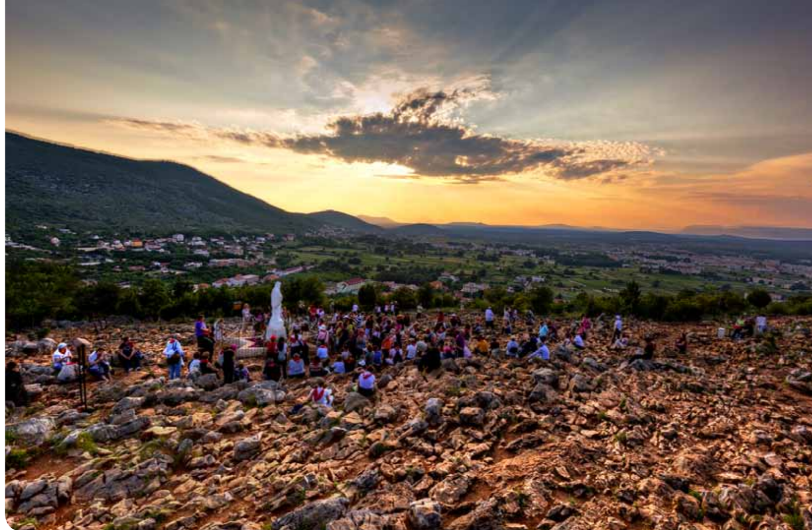
Brdo ukazanja - trideset godina poslije

Brojne su Gospine poruke koje pozivaju na obraćenje. To nije puklo ponavljanje iste pjesmice, nego se u tome može vidjeti stanovit dinamika i pedagogija majke koja ima strpljenja s neposlušnom ili nagluhom djecom. Na-