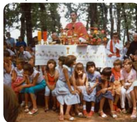
Misa u Gaju na blagdan sv. Jakova, 25. srpnja 1982.

molili su za ozdravljenje, nakon čega su posvjedočili da se Danijel mnogo bolje osjeća. I tako sve do naših dana – pojedinci svjedoče o ozdravljenju od raznih bolesti – od multiplex skleroze, karcinoma, oduzetosti, sljepoće od rođenja... O mnogim slučajevima napisani su članci, a talijanski liječnik dr. Gildo Spaziantje prije nekoliko godina objavio je i opsežnu studiju potkrijepljenu medicinskom dokumentacijom o najzanimljivijim slučajevima ozdravljenja na zagovor Kraljice Mira.