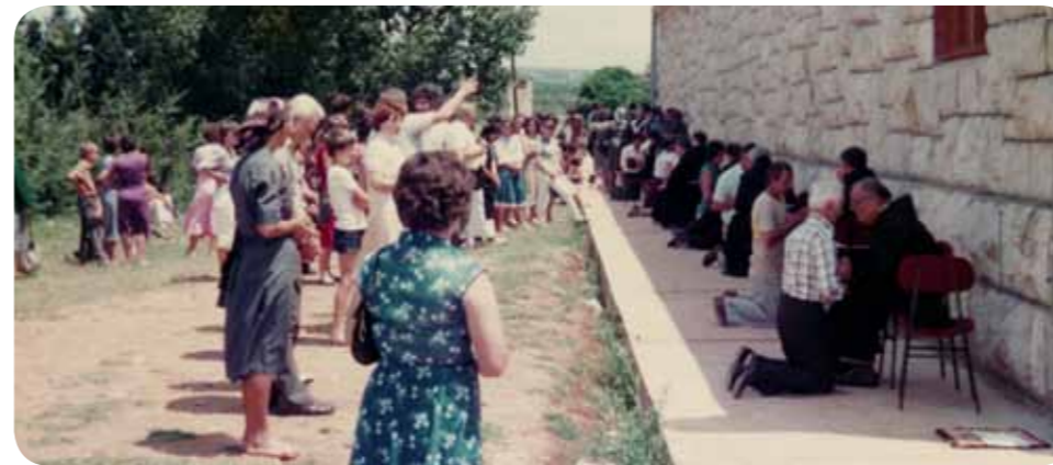
Ispovijed pored crkve, 24. lipnja 1983.

krajevima uvijek bila neprocjenjive vrijednosti. Naime, od to male vode kojom se raspolagalo u čatrnjama trebalo je zadovoljiti svoje kućanske potrebe, napojiti blago te imati za zalijevanje duhana pri sadnji i prskanje vinograda. Da bi zadovoljili potrebe za vodom, u svakom je selu, u nekima i po više, izgrađena lokva, rezervoar u kojem se skupljala kišnica za napajanje blaga. Svaki dječak koji je u to vrijeme znao plivati, to je naučio u lokvi. O vodovodu, znači izobilju vode, moglo se samo sanjati.