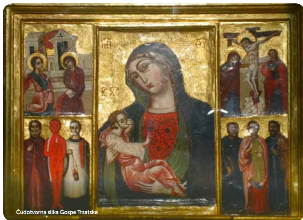
Čudotvorna slika Gospe Trsatske

Himan je sastavljen od 24 kitice s abecednim akrostihom. Polovica kitica, onih s neparnim brojem, počinju pjesnički izlagati je-