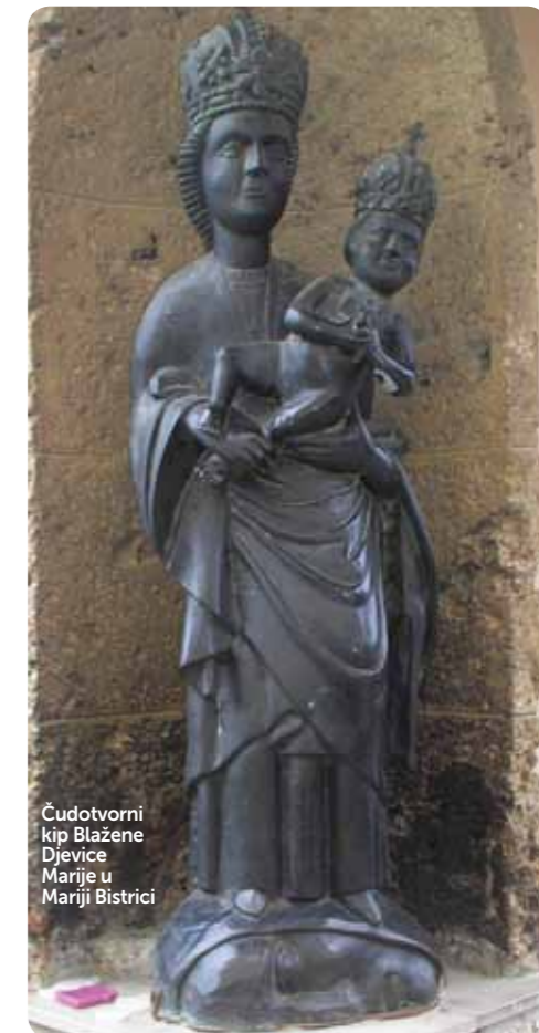
Čudotvorni kip Blažene Djevice Marije u Mariji Bistrici

Marija je s nama još i danas, kad nas opet zapljuskuju valovi gospodarske i novčane krize, krize zapošljavanja a iznad svega duhovne krize: slabljenje vjerničkog življenja, čudoredni nered u društvu, promicanje kulture smrti na račun kulture života (homoseksualizam, lezbizam i drugi oblici uništavanja obitelji), govor mržnje vodećih ljudi u politici jednih protiv drugih kao nekad u komunističkoj diktaturi. Zato nas Marija poziva, i u ovoj poruci, da se molimo, da se ne prestano i usrdno molimo njoj za obranu i zaštitu protiv svih protivnih vjetrova suvremene duhovne krize.