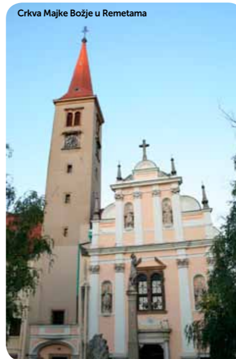
Crkva Majke Božje u Remetama

dan događaj iz života Marijina, nakon kojeg slijedi šest zahvala upućenih Blaženoj Djevici Mariji, punih divljenja i zahvaljivanja i završavaju klicanjem karakterističnim za molitvu „Zdravo, Djevo i Zaručnice“. Druga polovica tih kitica, parnoga broja, sastavljena je od riječi koje završavaju hvalbenim usklikom „aleluja“. Svaka kitica počinje opisom nekog događaja iz života Djevice Marije ili katkad iz života Isusova ili nekih drugih osoba koje su Mariji i Isusu bliske, da bi proslavile sudjelovanje Marijino ili Kristovo za spas ljudi. Na početku molitva počinje riječima kojima se molitelj utječe Mariji za posredovanje. Prema tradiciji, molitvu su vjernici Carigrada po prvi put molili za jednog bdiženja moleći se za spas grada.