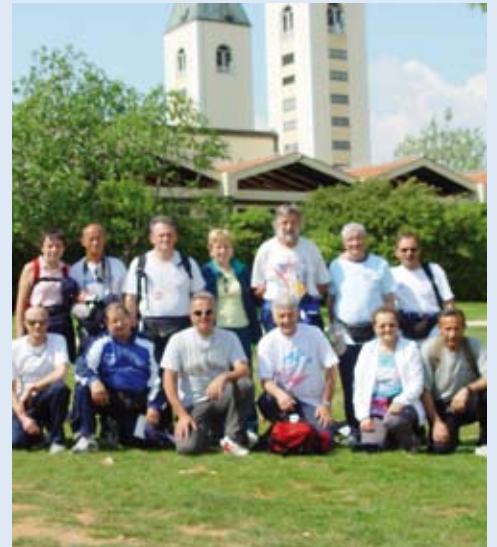
ago de Compostella, a sljedeće godine namjeravaju poći u Jeruzalem.

Ova skupina svake godine organizira slične štafete u razna svetišta. Od većih europskih svetišta već su tako pohodili Lurd, Fatimu, Loretto, Čenstohovu i Santi-