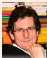
FRA ANTE VUČKOVIĆ

U Isusovu pogledu s kojim se Petar susreo onoga jutra kada je Isus izvođen iz sudnice bila je vidljiva apsolutna ljubav i apsolutno poznavanje Petra i njegove duše. Petra je slomila Isusova ljubav. Samo susret s pogledom u kojem nema osude i prigovora, a u kojem vidim ljubav, može otvoriti srce kajanju.