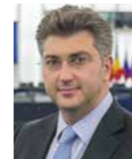
MR. SC. ANDREJ PLENKOVIĆ, POTPREDSJEDNIK VANJSKOPOLITIČKOG ODBORA EUROPSKOG PARLAMENTA

ZAVRŠETAK HLADNORATOVSKE PODJELE EUROPE I PROPAST KOMUNIZMA, SIMBOLIČKI OSNAŽENI PADOM BERLINSKO- GA ZIDA, EUROPSKO PROŠI- RENJE I UJEDINJAVANJE, ALI I ZNAČAJNO JAČANJE SEKULA- RISTIČKIH IDEOLOGIJA PROMI- JENILI SU DRUŠTVENI OKVIR U KOJEM DANAS DJELUJE EUROPSKA UNIJA. Usprkos tomu, misli pape Franje izgovorene u Parlamentu iznimno su slične poruci nade koju je sveti Ivan Pavao II. 1988. podijelio sa zastupnicima tada samo 12 država članica, a s istom porukom presudno je utjecao i na rušenje komunizma