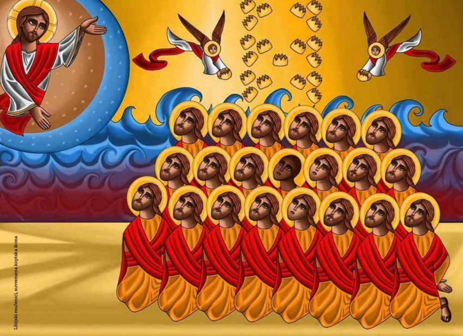
Libijski mučenici, suvremena kopirana ikona