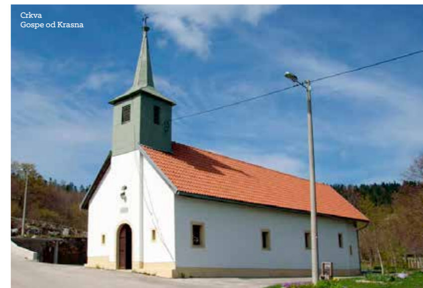
Crkva Gospe od Krasna