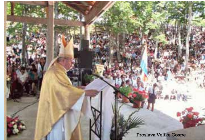
Proslava Velike Gospe

ispod kapele bilo na hrpe štapova što ih odbaciše hromi koji su tamo došli na štakama, a kući se vratili bez njih, posve zdravi. I u njegovo vrijeme bili su u udubini oltara obješeni brojni znakovi kao zahvala za Gospine milosti. Među narodom se prenose razne zgode: kako je Gospa od Krasna pomagala u olujama na moru, u pogiblima na kopnu, u teškim bolestima, u suhim godinama i svakojakim drugim nevoljama. U nepomućenoj tišini i nedirnutoj prirodi ovo je mjesto pogodno za molitvu i razmišljanje.