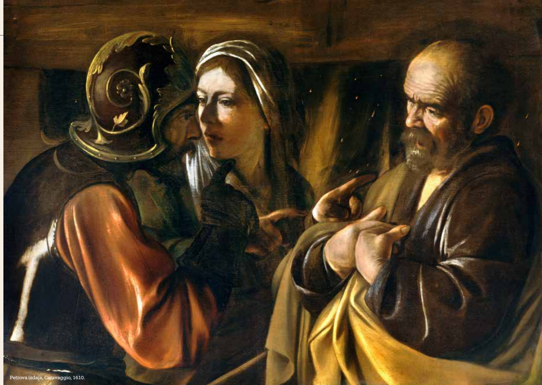
Petrova izdaja, Caravaggio, 1610.

Kad izbližega pogledamo ovaj tekst koji opisuje susret Levija Mateja i Isusa, opazimo odmah da je Isus ugledao čovjeka u carinarnici. Carinici su u Isusovo vrijeme bili omraženi. Radili su za neprijatelja, za Rimljane. Redovito su bili bogatiji od drugih. Bogatili su se na račun svojega naroda surađujući s okupatorom. Židovi ih zbog toga nisu voljeli. Isus je i njih vidio drukčije. Matej kaže da je Isus ugledao čovjeka zvana Matej. Drugi su u Mateju vidjeli carinika, suradnika s neprijateljem, grješnika. Isus je, naravno, sve to znao. Pa ipak, kao da ne vidi ništa od toga. On vidi čovjeka koji ima ime. Matej se susreo s pogledom koji nikada prije nije vidio. Tko je bio u Rimu i otišao pogledati maestralnu Caravaggiovu sliku Matejeva poziva, mogao je vidjeti prekrasnu sliku carinika na kojega pada svjetlo s Isusova lica, svjetlo koje dolazi s Isusove strane. Matej pokazuje prstom na sebe i gledatelj kao da čuje pitanje: „Zar mene?“ Matej gleda prema Isusu i susreće se s njegovim