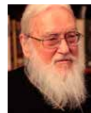
BISKUP KALLISTOS WARE

Iako duhovnici nisu zaređeni niti ih itko postavlja na tu dužnost, sigurno je da moraju biti pripremljeni . Ta se priprema odvija po klasičnom modelu bijega i povratka, što se jasno raspoznaje u životima svetoga Antuna Velikoga i svetoga Serafima Sarovskog.