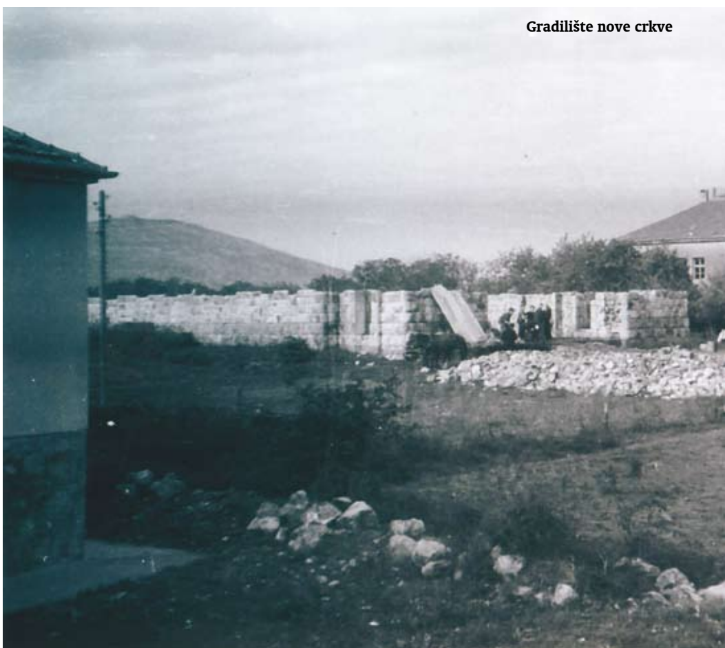
Gradilište nove crkve

Za gradnju je fra Serafin prikupio 9.700 dinara, a njegov nasljednik fra Bernardin Smoljan u kratkom razdoblju još 16.000 dinara. Prva je zadaća bila kopanje i prijevoz kamena. Na javnom natječaju taj su posao dobili župljani Ilija Čilić + Joze i Jakov Vasilj + Joze. Za četiri mjeseca iskopano je krupnoga kamena, prevezeno i složeno kod stare crkve oko 1100 m 3 . Utrošeno je 24.500 dinara. U godini 1932. na otkupu duhana u Čapljini župnik je također dobio postotak od 2%, kako je bio odredio crkveni odbor. U veljači i ožujku 1932. «spa-