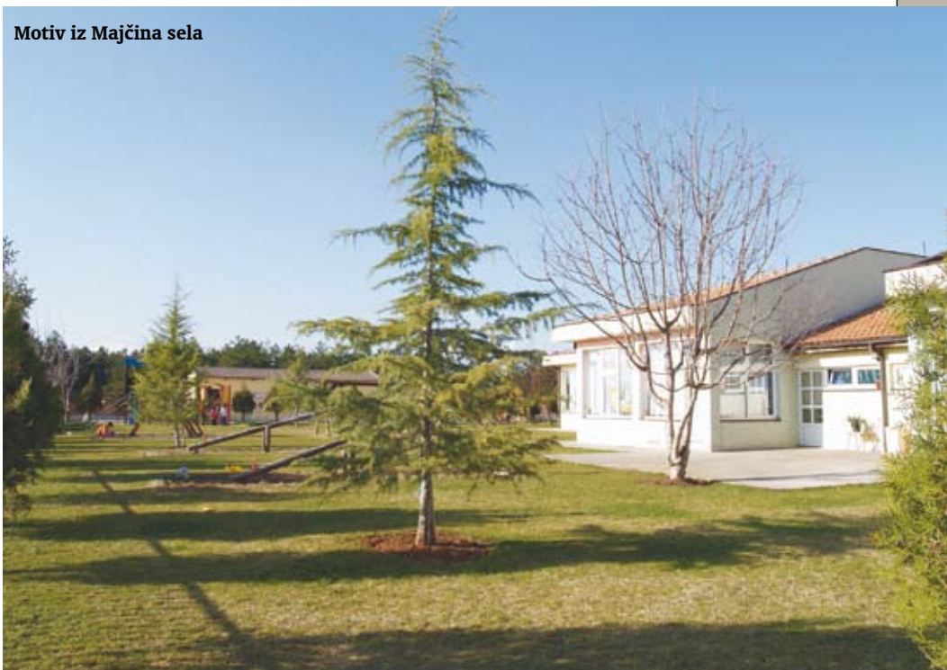
Motiv iz Majčina sela

Nije uvijek lagan život toj djeci, mi ne pretendiramo biti neki savršeni svijet za njih, ali