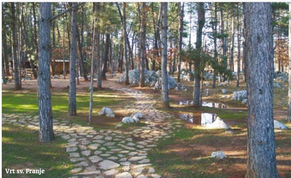
Vrt sv. Franje

ću slobodno kazati da dobivaju više nego prosječno dijete u ovoj državi. Djeca to znaju, nedavno mi je jedna djevojka kazala kako sada malo bolje vidi kakvim je opasnostima bila izložena. Zahvalna je Bogu, kao i ostali, da je ovdje upoznala i Boga i molitvu i kršćanski način života.