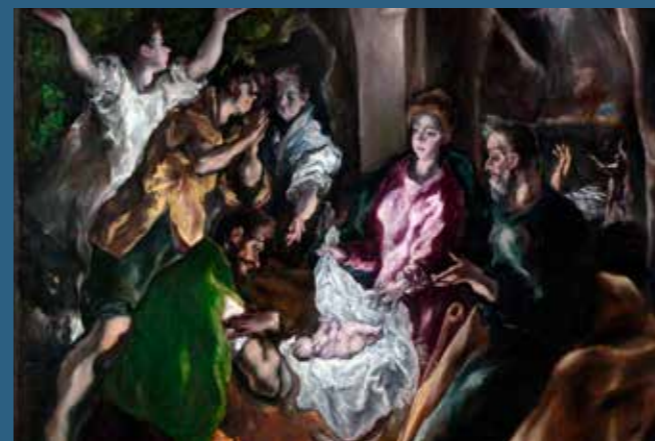
Fotografija na naslovnici: El Greco - Poklonstvo pastira