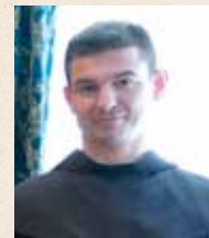
FRA PETAR KOMLJENOVIĆ

POSTOJI VELIKA RAZLIKA IZMEĐU KRŠĆANINA I NEKRŠĆANINA, IZMEĐU VJERNIČKOG I NEVJERNIČKOG POGLEDA NA BUDUĆNOST. Nevjernik ne zna što će doći, budućnost je za njega otvorena, tajanstvena tako da se sve može dogoditi – i dobro i zlo. Zato je nesiguran i bojažljiv. Vjerni kršćanin, naime, zna što će doći jer mu je Božja riječ objavila budućnost. Zato je siguran i pun pouzdanja. To se pouzdanje zove nada .