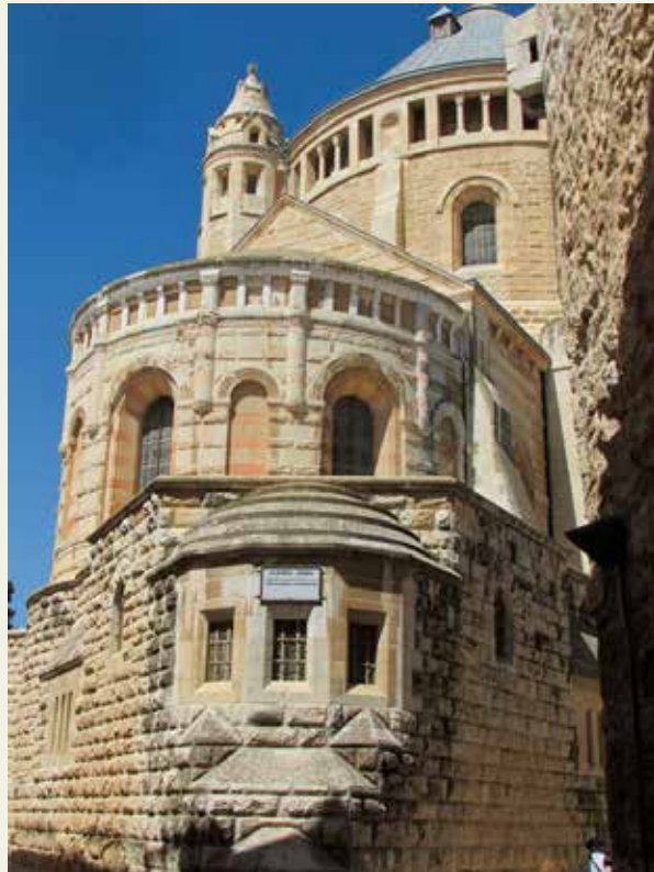
Crkva Usnuća Marijina.

koji je povezivao Jeruzalem i Jerihon prolazio je upravo Maslinskom gorom.