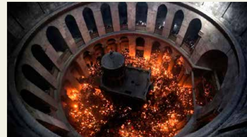
Unutrašnjost bazilike Svetog groba