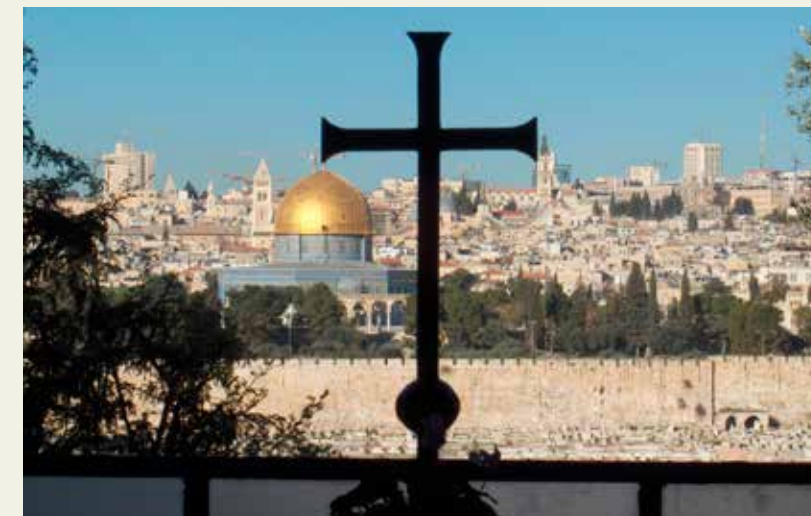
Pogled na panoramu Maslinske gore.