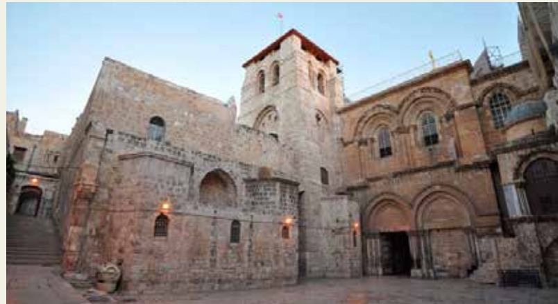
Crkva Isusova Groba