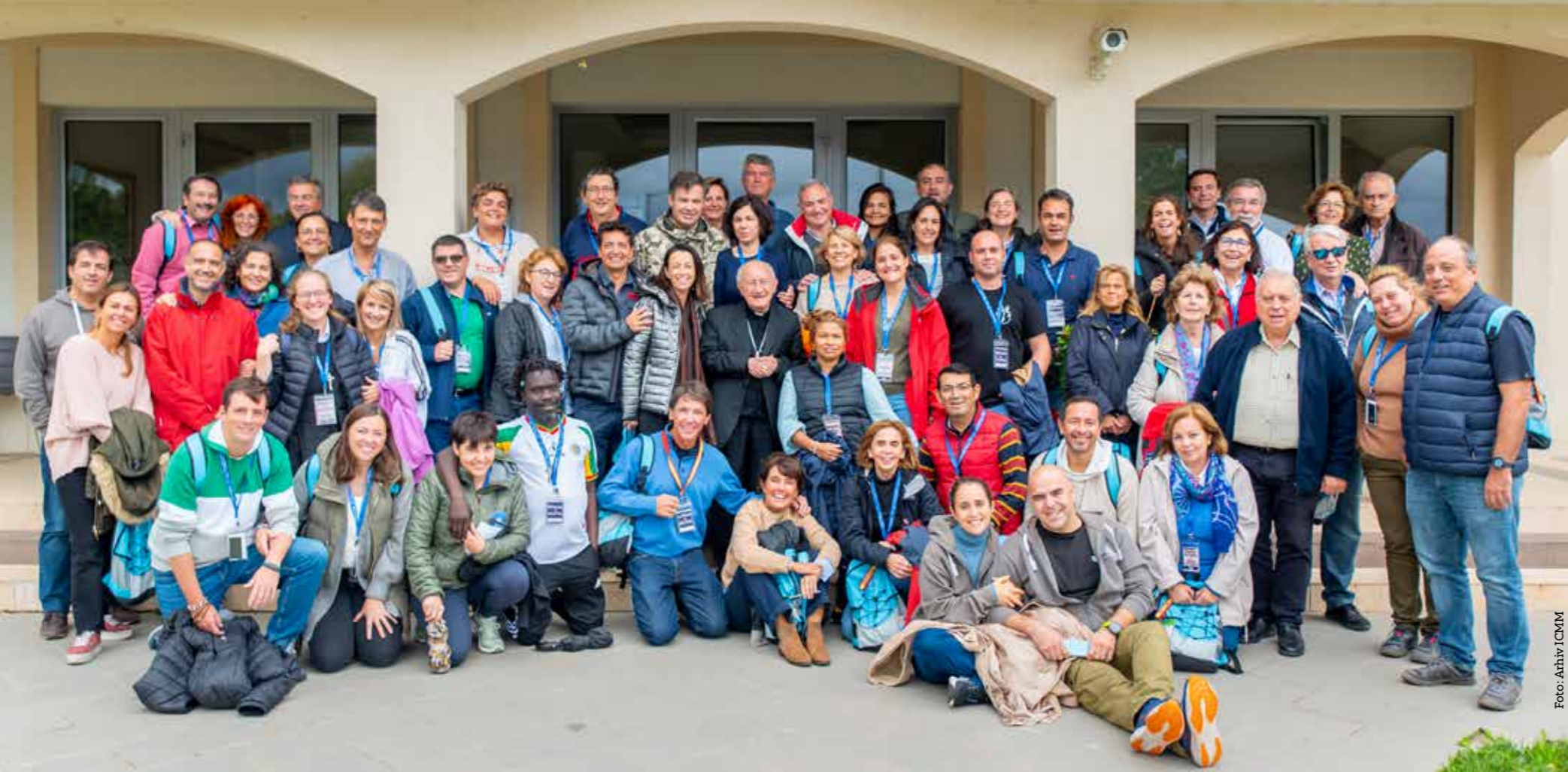
30 bračnih parova iz Španjolske, Kostarike i Kolumbije hodočastilo u Međugorje