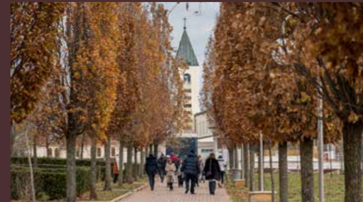
Fotografija na naslovnici: Foto Arhiv ICMM