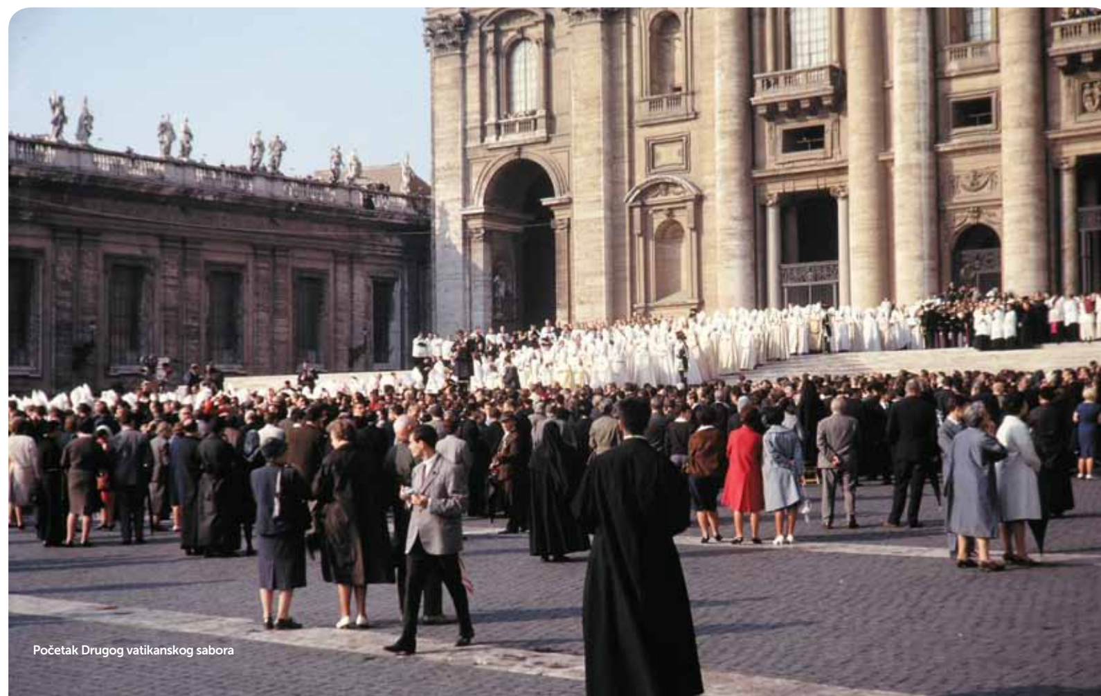
Početak Drugog vatikanskog sabora

Dakle, prava narav Crkve jest biti odsjaj, zrcalo Kristova svjetla u svijetu. To bi morao biti i pastoralni imperativ u svim proglasima koji će uslijediti u ovoj godini vjere. Ne trebamo se toliko baviti strategijama, planovima, propisima, proglasima, nego onim bitnim, što nije plod strategije, nego Božjega djela u Crkvi. To je pak prisutnost samoga Gospodina u Crkvi i djelotvornost preko sakramenata i navještaja Radosne vijesti. Nerijetko polazimo od pretpostavke da današnji čovjek vjeruje, što zapravo i nije istina. Trebamo moliti za ponovno oživljavanje vjere u suvremenom čovjeku, pa i u onima koji su već kršteni.