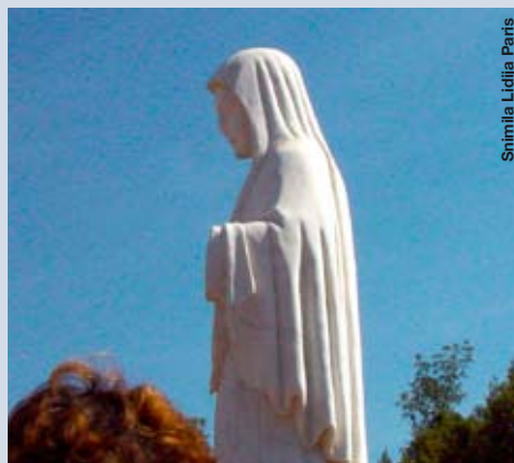
Stimila Lidija Paris

Prvi kip Kraljice Mira, koji je postao simbolom Međugorja, postavljen je 1987. na trgu pred crkvom, a kip na Brdu ukazanja dar je korejskih hodočasnika u čast 20. obljetnice ukazanja.