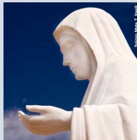
Stimio Mate T. Vasilij