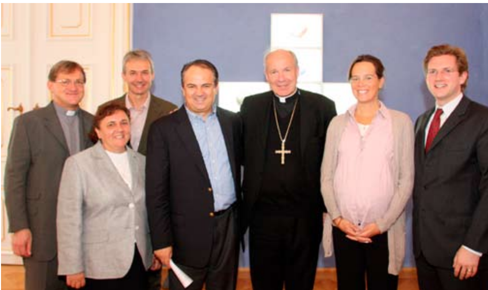
Ivan, kardinal Schönborn i prijatelji Međugorja

Dirljiva je bila i molitva Vjeronanja i sedam Očenaša. Zdravomarija i Slavaocu za mir, poslije sv. Mise, koju su svećenici i vjernici molili klečeći.