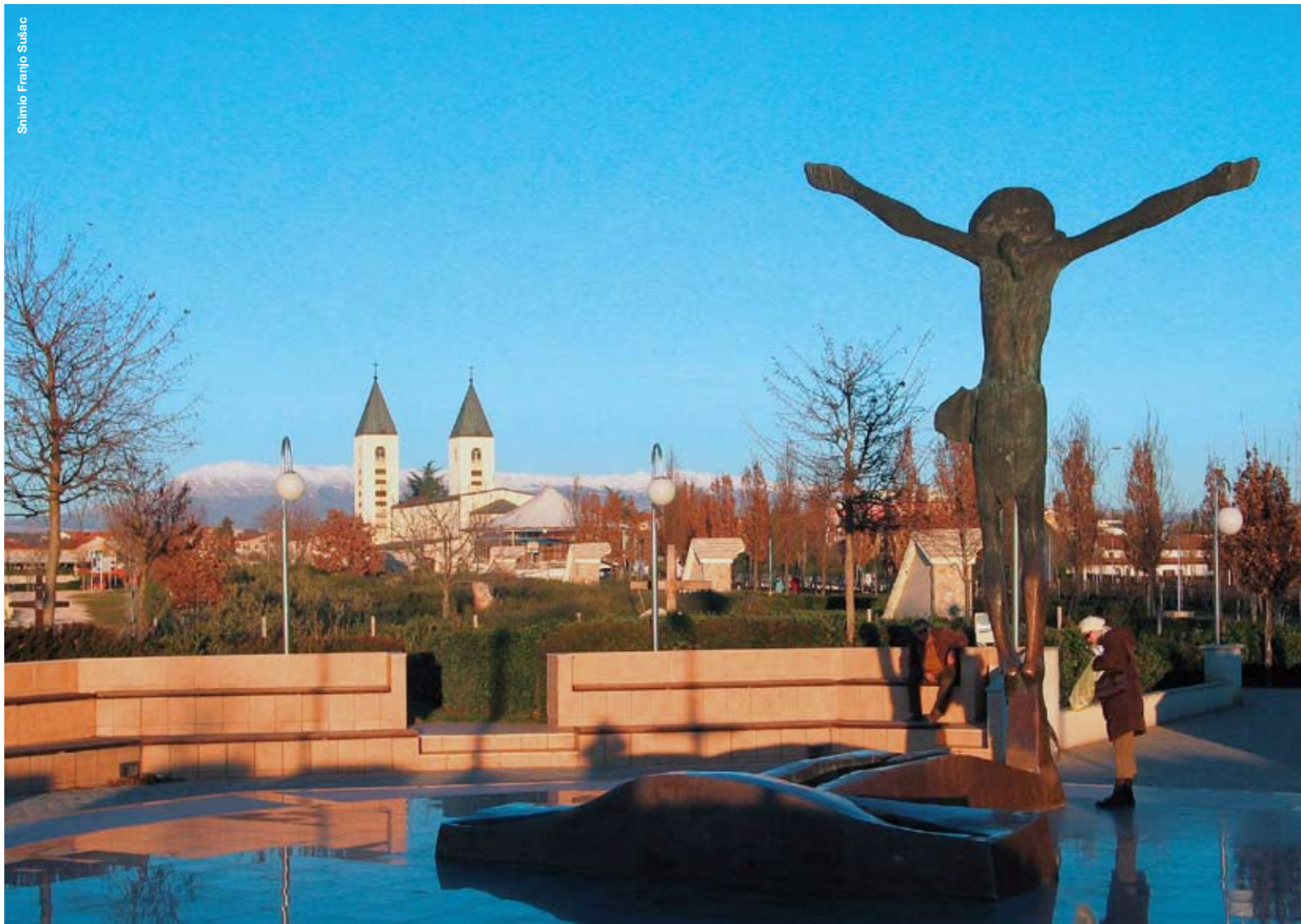
Shimio Franjo Šušac

Budimo svjedoci Radosne vijesti i radujmo se onom iskonskom radošću na koju nas poziva sv. Pavao: "Braćo! Radujte se u Gospodinu uvijek! Ponavljam: Radujte se! " (Fil 4,4). Ne budimo kao kopači zlata koji se muče cijeli život i traže zlato, iskopavaju ga, pronalaze, a uvijek ostaju najsiromašniji iako drže zlato u rukama. Neka novorođeni Isus blagoslovi novu, 2009. godinu, cijeli naš život i sva naša plemenita nastojanja.