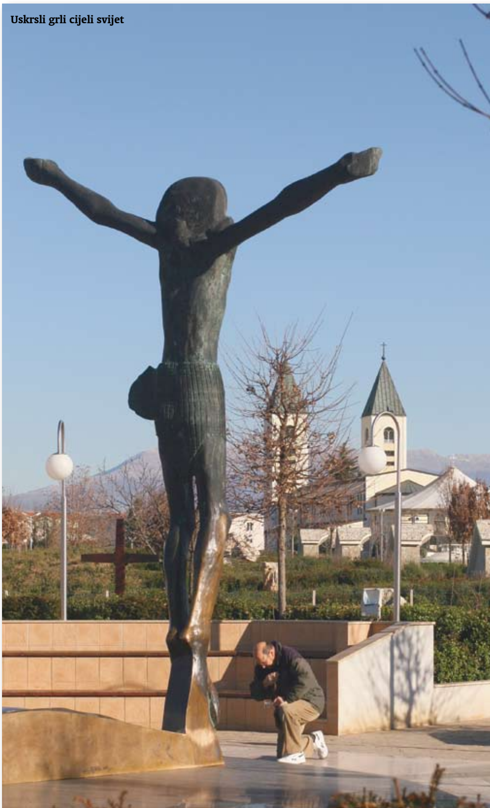
Uskrsli grli cijeli svijet

Kao dječak car je doživio kako mu carska tjelesna straža ubija oca i brata te ostalu rodbinu. Smatrao je da iza toga brutalnoga zlosilja stoji sam car Konstancije koji se pravio velikim kršćaninom. Time je kršćanstvo za njega bilo jednom zauvijek otpisano, postalo nevjerodostojno. Kad je sam postao car, odlučio se uspostaviti staru rimsku religiju, reformirati poganstvo, a iz kršćanstva je preuzeo upravo ono što ga se ponajvećma doimalo, naime, karitas , ljubav. Treba, stalno je naglašavao, nadmašiti Galilejce upravo u ljubavi. Time je djelatnu ljubav priznao kao odlučnu značajku kršćanske zajednice, onaj raspoznajni znak koji ljude privlači Kristu.