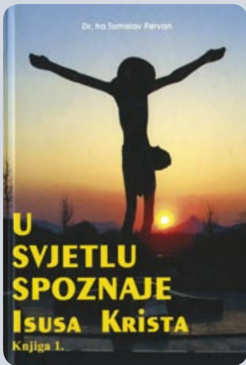
Fra Tomislav Pervan U SVJETLU SPOZNAJE ISUSA KRISTA Knjiga 1.

Stranica: 238 Format: 14 x 21 Cijena: 15 KM