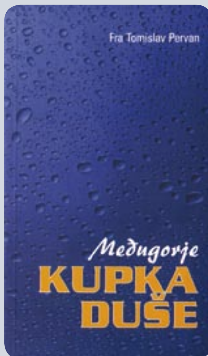
Fra Tomislav Pervan MEĐUGORJE – KUPKA DUŠE

Stranica: 238 Format: 14 x 21 Cijena: 15 KM