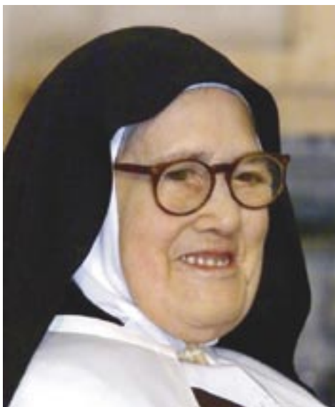
S. Lucija dos Santos (+13.2.2005.), fatimska vidjelica

Naglašavati to ne znači biti natražnjak, nekakav jučerašnji, nego su upravo osvjeđeni vjernici i misionari kroz svu prošlost bili pioniri koji su krčili put u budućnost. Oni su bili istinski prometeji – oni koji misle unaprijed, prema budućnosti, a ne natražnjački.